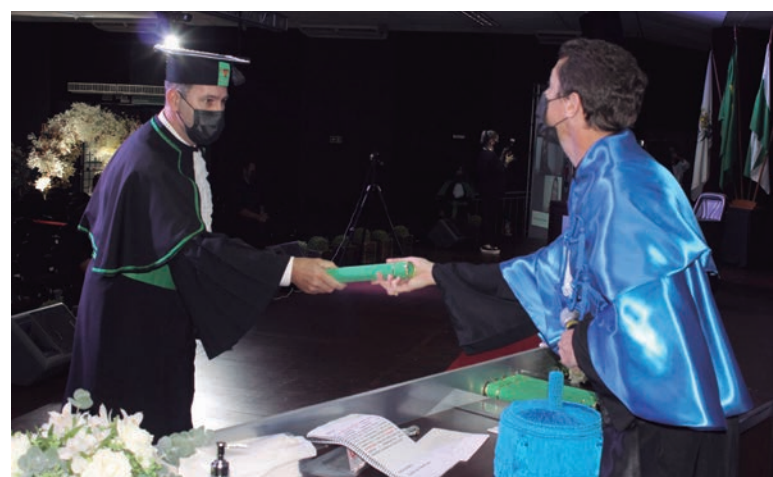
Unipar diploma novos profissionais de Enfermagem