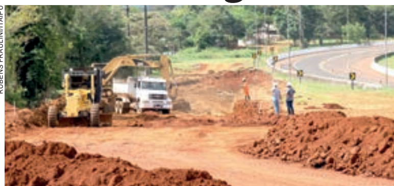
É o quarto ponto de obras da pista que ligará a futura Ponte da Integração à BR-277

O projeto dos 15 quilômetros da avenida prevê seis interseções em desnível nos entroncamentos com a Avenida General Meira, no acesso para a Ponte Tancredo Neves,