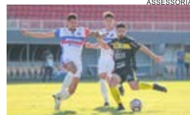
CCR e FCC fizeram o melhor jogo do estadual na tarde de ontem