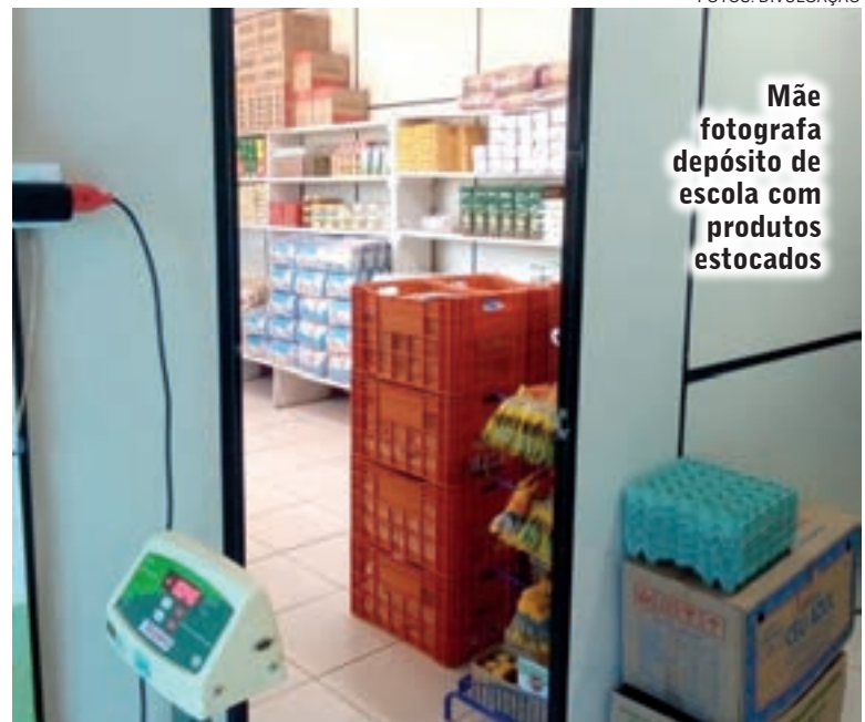
Mãe fotografa depósito de escola com produtos estocados

Acesse pelo QR code vídeo divulgado pela prefeitura com o que seria o kit da merenda efetivamente distribuído aos pais