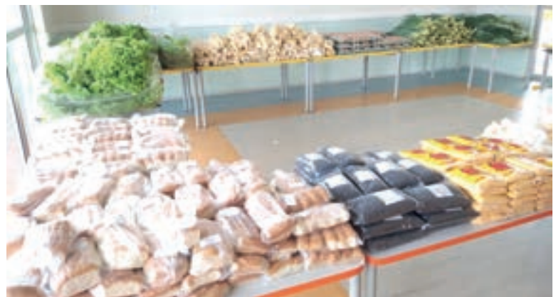
Secretária divulga vídeo com “verdadeiros” kits