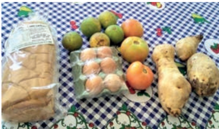
Pais divulgam kit merenda recebido esta semana