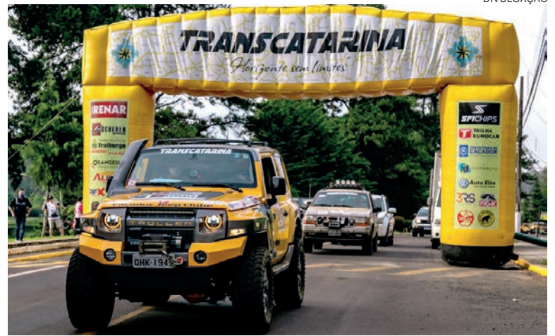
O Transcatarina é uma das mais tradicionais competições de regularidade do off-road

vacinada (ou a maior parte) e a rede de saúde recuperada. “Entendemos que, na nova data, poderemos fazer um Transcatarina mais livre. Livre de preocupações e sem tantas restrições. Entendemos que chegaremos em um momento importante para a recuperação econômica, portanto, teremos a missão de levar riquezas aos municípios, mas não somente em consumo local, como também por meio das nossas ações sociais (como a doação de cestas básicas). Mencionando ainda o incentivo ao turismo, uma vez que atraímos pessoas de diversas regiões do Brasil, que postam fotos em suas redes sociais, e, claro, por meio de nossa divulgação, uma vez que sempre