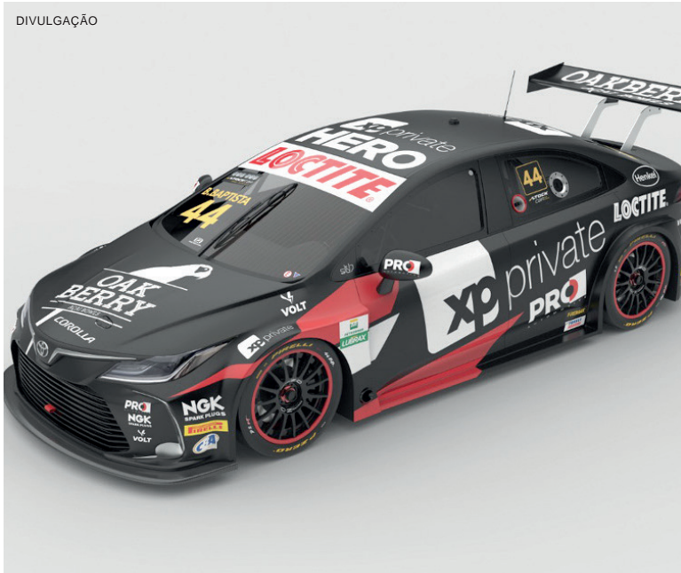
O Stock Toyota Corolla número 44 de Bruno Baptista passou a ter novo layout de cores e pintura

Tecnicamente, o Stock Corolla da temporada 2021 será idêntico ao do ano passado, utilizando motor V8 de 6,8 litros movido a gasolina, com a mesma potência de 460 cv e torque de 61,2 mkgf em utilização normal e até 550 cv e torque de 71,4 mkgf com o “push to pass” (botão de ultrapassagem acionado). Na carroceria, terá o mesmo spoiler dianteiro e aerofólio traseiro que permitirão dois pacotes de utilização dos componentes aerodinâmicos para maior equilíbrio na disputa com os pilotos de Chevrolet Cruze.