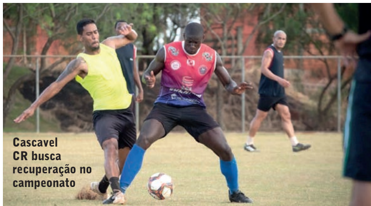
Cascavel CR busca recuperação no campeonato

O apelo da defesa é de que a pena aplicada seja apenas de multa, o que pode fazer com que a equipe permaneça na liderança do campeonato.