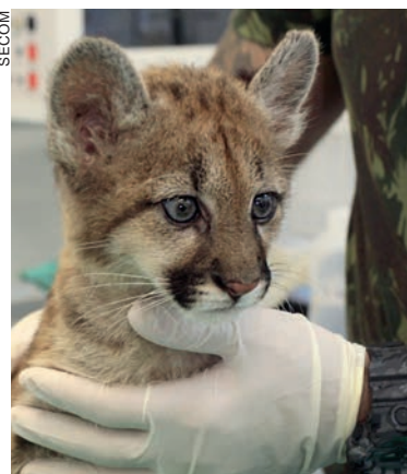
Saudável, a pequena vai morar no zoo de Cascavel

A prefeitura lançará em breve uma campanha para oportunizar ao cidadão cascavelense escolher o nome da nova moradora do Zoo.