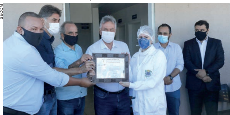
Nova unidade vai atender região com 3,5 mil habitantes