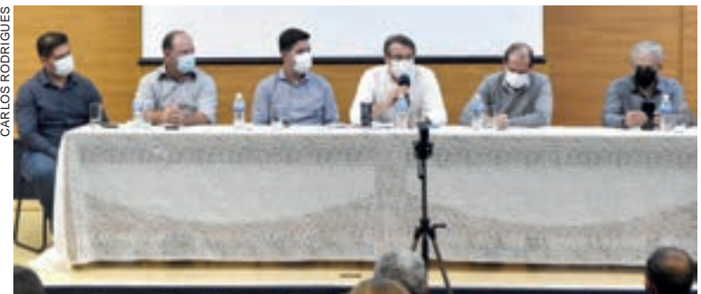
Toledo entra na rota do Estado e recebe terceira visita em 40 dias