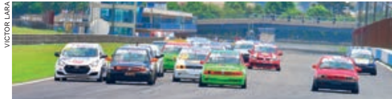
A prova do próximo dia 23 irá apontar os campeões da temporada do ano passado

A FPrA (Federação Paranaense de Automobilismo) marcou para o próximo dia 23 a decisão do Campeonato Paranaense de Velocidade de 2020. A prova não pôde ser realizada em dezembro e em fevereiro em função da pandemia do coronavírus. A disputada será no Autódromo Internacional de Curitiba, situado em Pinhais, na Região Metropolitana da Capital Paranaense, e será válida também pela final do Campeonato Metropolitano de Curitiba. A promoção e a organização serão da M & L Produções Artísticas Ltda.