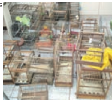
Pássaros serão soltos e papagaios voltarão ao infrator

A criação amadora de pássaros silvestres é permitida seguindo as determinações da Portaria IAP 174/2015 e da Lei Estadual 19.745/2018. A pessoa precisa ter cadastro no IAT e manter os animais em viveiros