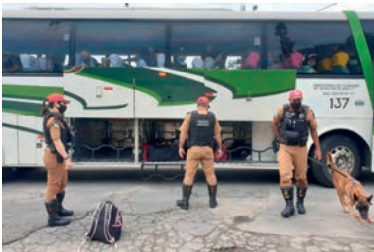
Uso de animais treinados foi ampliado, em especial em operações pontuais

Em relação a armas de fogo, o número também cresceu nas operações com cães. Em 2020, houve 186 apreensões, contra 141 efetuadas em 2019. De janeiro a abril de 2021, foram 48 armas