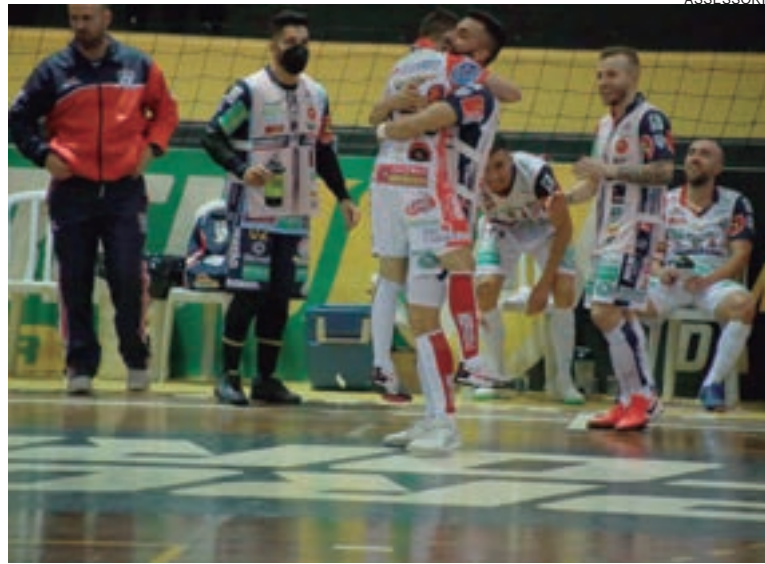
Cascavel goleou o Siqueira Campos e assumiu a liderança do estadual

O Marechal Futsal vem fazendo bonito em sua primeira participação na LNF. Na noite de quinta-feira, o time jogou em Santa Catarina e venceu o Tubarão, por 4 a 0, assumindo a liderança do Grupo C. Outro paranaense na competição, o Umuarama, perdeu para