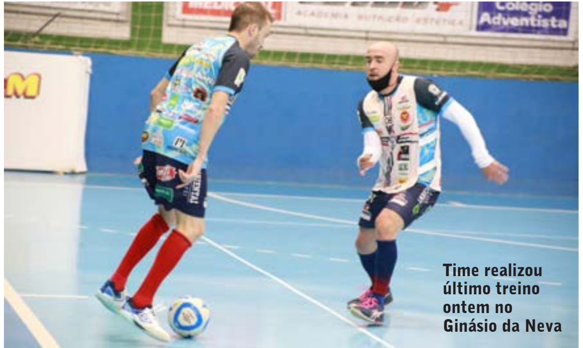
Time realizou último treino ontem no Ginásio da Neva

A estreia cascavelense será no dia 20 de junho contra os donos da casa.