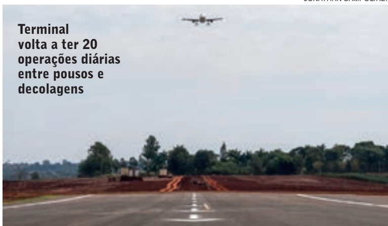
Terminal volta a ter 20 operações diárias entre pousos e decolagens

A análise da Paraná Turismo destaca, no entanto, que o Aeroporto Cataratas, em Foz do