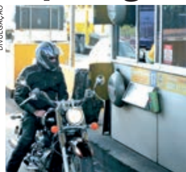
Isenção de pedágio a motos divide opiniões

Contudo, o deputado alerta para uma situação ainda mais grave: o risco que isso representa nas estradas. Para o deputado, se isentar totalmente as motocicletas, a tendência é que aumente o número de motos nas rodovias, podendo gerar problemas de segurança no trânsito. “Se isenta, a tendência é de que haja um aumento desse veículo nas rodovias. Ou seja, deve aumentar o número de motociclistas e isso gera um problema sério de segurança. A maioria dos acidentes graves, com vítimas fatais, nas cidades, envolvem motocicletas. Embora haja um desgaste menor por parte das motos,