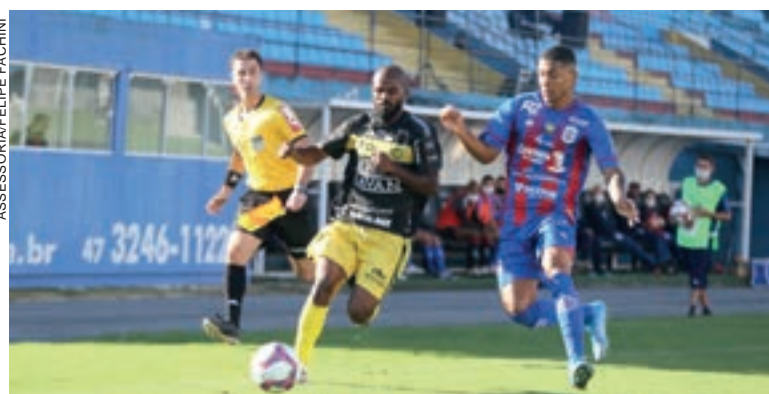
FCC somou o segundo empate na Série D

Cascavel - A edição 2021 da Série D ainda não teve uma vitória dos representantes paranaenses na competição mesmo após as duas rodadas disputadas. FC Cascavel e Cianorte tiveram dois empates cada, um em casa e outro fora, enquanto o Rio Branco sofreu sua primeira derrota no fim de semana, e de goleada, para o Caxias, próxima adversário do FCC. Com essa combinação, nenhum dos times está na zona de classificação de seus grupos.