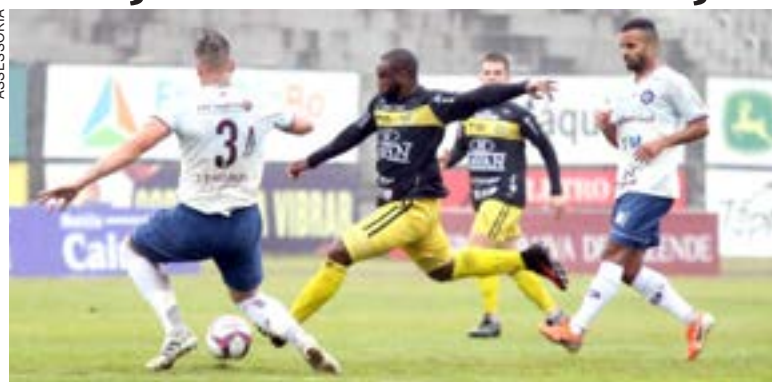
Time garantiu a primeira vitória na competição

O FC Cascavel é o melhor paranaense na Série D. No mesmo grupo, o Rio Branco,