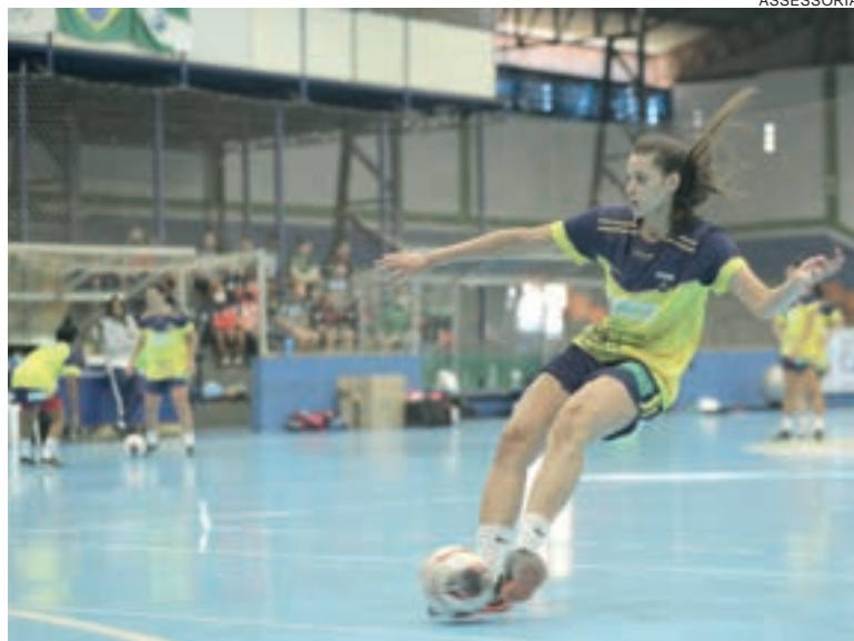
Equipe segue treinando forte para defender a liderança

Após duas rodadas disputadas, o Stein Futsal divide a liderança da competição com as equipes do Cianorte e do Telêmaco Borba, com 6 pontos em dois jogos disputados.