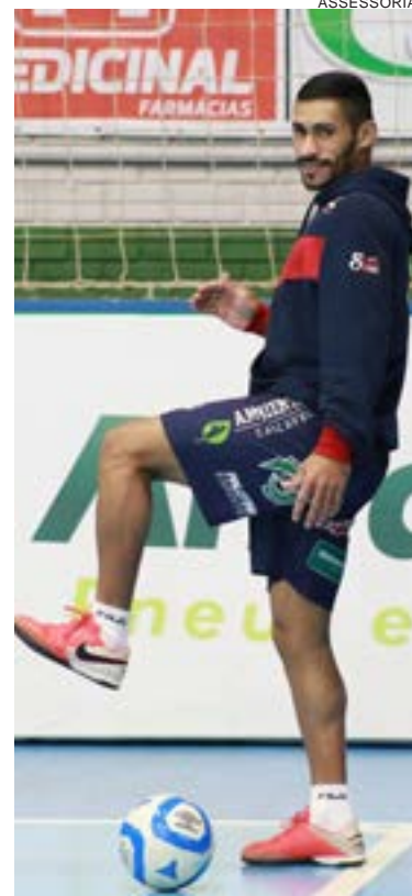
Cascavel tenta quebrar série negativa em casa contra o Marechal