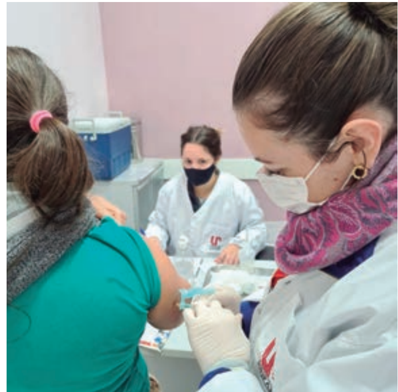
Campanha atende população em geral, acima de 3 anos

Na Unipar, vacinação acontece no Centro de Saúde Escola