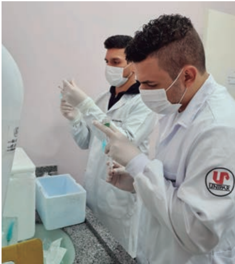
Curso de Enfermagem auxilia em campanha de vacinação

que, para os alunos, é um momento importante de reconhecimento das demandas de saúde coletiva e de poder colocar em prática os conhecimentos adquiridos na graduação.