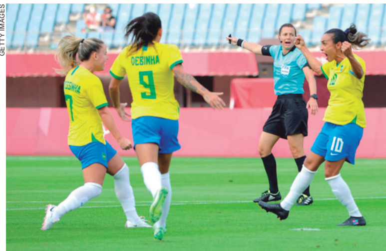
Futebol feminino estreou com goleada na Olimpíada

"A gente trabalha para isso, para estar sempre evoluindo e buscando bater nossos próprios recordes. A felicidade é enorme, principalmente pelo que a gente apresentou, já que os gols são consequência do que você mostra em campo. Claro que o time não foi 100% perfeito, mas o importante foi o resultado. Agora é fazer esses ajustes e pensar já no próximo