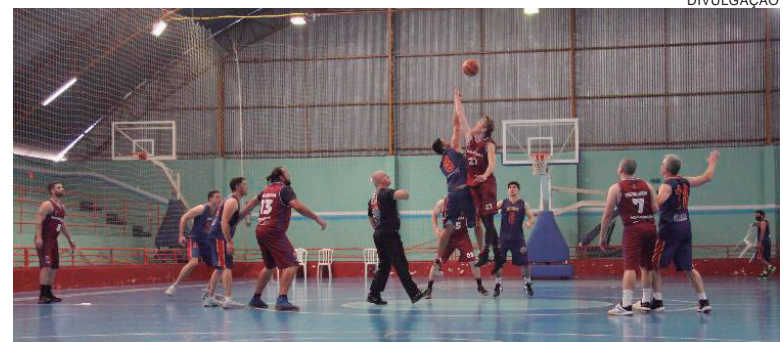
Abasmavel deu início à 5ª edição da Liga

16. Confira os outros resultados: Colégio Cristio Rei 45x72 Corbéia; Medianeira 59x35 Hoops Cascavel; Szymanski 44x60 Wilson Jofre; Operário 57x22 Honda Eco centauro; Toledo 67x55 colégio Semeador; Black Sox 82x28 Honda Eco centauro. Os próximos jogos devem acontecer sábado e domingo no Ginásio Eduardo Luvison.