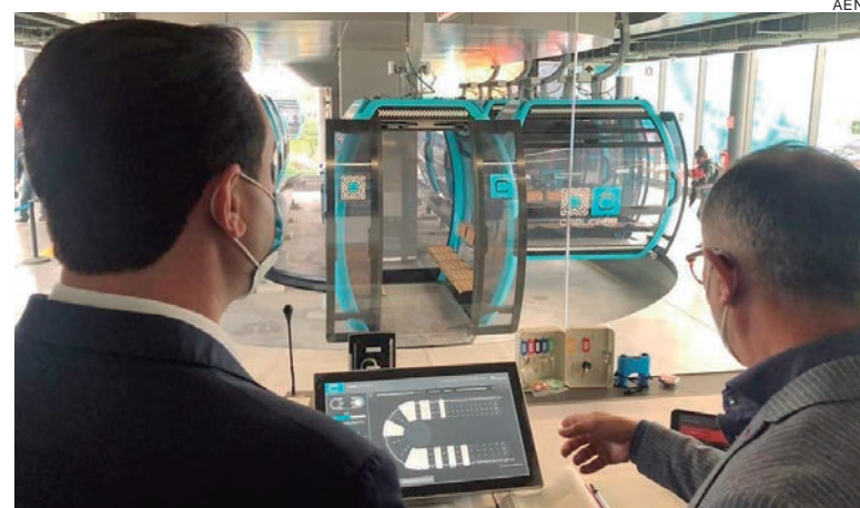
Governador visita o Cablebus, que transporta de 40 mil a 50 mil passageiros diariamente

Segundo o governador, o transporte público por teleférico é um exemplo de inovação que também tem sido adotada em outras regiões, como em Londres e na Bolívia. "Esse percurso, de cerca de 10 quilômetros, levava uma hora e meia de ônibus e agora pode ser percorrido em até 30 minutos. A linha faz a ligação entre bairros populosos e é possível fazer a integração com outros modais, como ônibus e metrô", ressaltou.