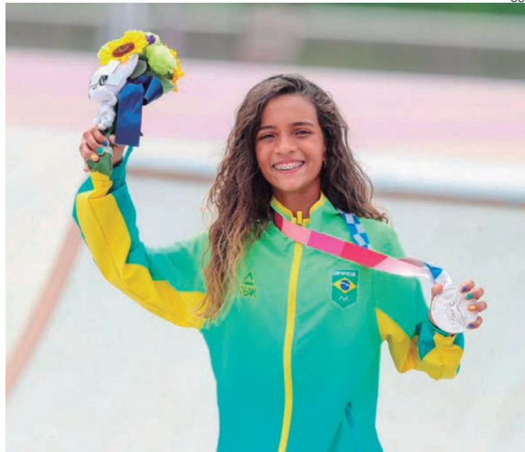
Medalha de prata histórica no skate com apenas 13 anos de idade

"Não caiu a ficha ainda... Poder representar o Brasil e ser uma das mais novas a ganhar uma medalha. Eu estou muito feliz, esse dia vai ser marcado na história. Eu tento ao máximo me divertir porque eu tenho certeza de que, se divertindo, as coisas fluem... deixe acontecer naturalmente, se divertindo", disse o atleta, que cativou o público brincando, dançando, aplaudindo as manobras das adversárias e se divertindo enquanto competia contra as melhores do mundo na final em Tóquio.