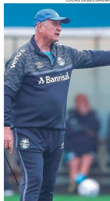
Felipão segue com desfalques para escalar o time

Felipão deve voltar com o esquema 4-2-3-1, já que não contará com Kanemann, Rafinha, Douglas Costa e Diego Souza.