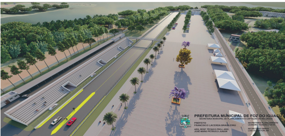
Complexo está sendo construído numa área de 71,9 mil m 2 , em três etapas

A prefeitura vai licitar na próxima segunda-feira (9) a segunda fase das obras do Complexo Esportivo Multiuso da Pista de Arrancada de Foz do Iguaçu - mais conhecido como Velofoz. Essa etapa inclui obras de terraplanagem e edificações que serão executadas com recursos conveniados com o Ministério das Cidades.