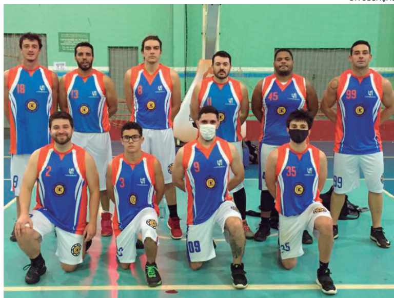
Equipe do Guaraniçau/8'ers garantiu vitória na rodada

No próximo sábado acontecem alguns jogos pela quarta rodada, sempre no