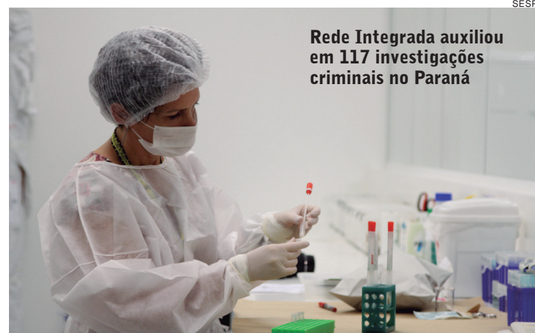
Rede Integrada auxiliou em 117 investigações criminais no Paraná

O material genético é coletado pela saliva, em método indolor, por meio de um dispositivo que se assemelha a uma esponja, permitindo que o DNA fique até 20 anos armazenado em temperatura ambiente. O procedimento segue um protocolo que não expõe o perito e