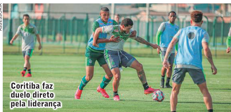
Coritiba faz duelo direto pela liderança

Além da liderança, o time paranaense tem outro motivo para comemorar. Em julgamento realizado quarta-feira no STJD (Superior Tribunal