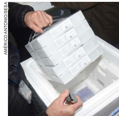
Novas doses só devem chegar às cidades na próxima semana

Até ontem, o Ministério da Saúde confirmou o envio de 207,1 milhões de doses para estados e municípios. Dessas, 168 milhões já foram aplicadas, sendo 117 milhões primeiras doses e 51,1 milhões segundas doses ou doses únicas da vacina.