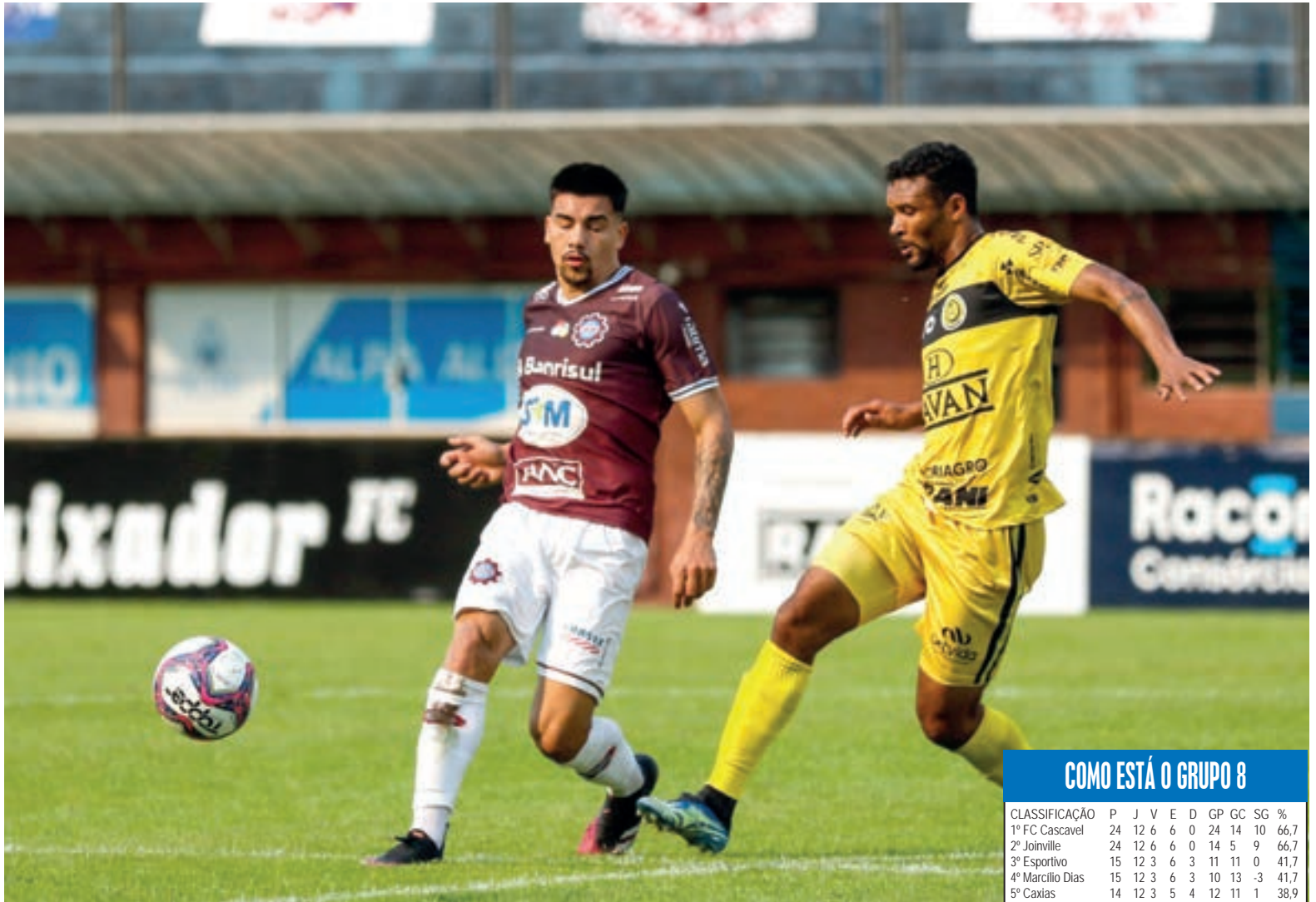
Jogo em Caxias teve FCC com maior posse de bola

Apesar do compromisso em casa, no próximo sábado, pela penúltima rodada, o pensamento da comissão técnica é de poupar alguns jogadores para descanso visando à primeira partida da semifinal do Paranaense, dia 1º de setembro, contra o Athletico.