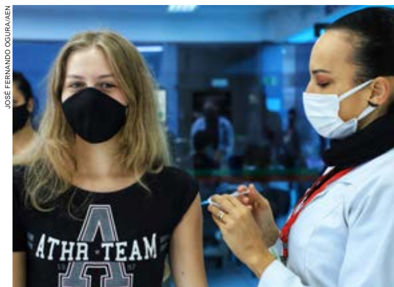
Nesta terça-feira, será feita repescagem de quem perdeu o cronograma

A estimativa do Ministério da Saúde é que Toledo tenha 110.052 pessoas acima de 18 anos. Dessas, 102.850 receberam a primeira dose (D1) ou dose única (DU), chegando a 93,4% da população vacinada com pelo menos uma dose nessa faixa etária.