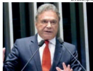
Senador Alvaro Dias é citado na lista dos mais influentes

Segundo o Diap, neste ano, a escolha dos parlamentares mais influentes foi impactada por dois episódios, ambos decorrentes da pandemia. O primeiro foi a adoção do sistema remoto de deliberação, que dificulta identificar os parlamentares mais presentes nas articulações e nas negociações, já que essas ficam muito restritas a líderes e relatores nesse período. O segundo foi o início da instalação das comissões permanentes da Câmara dos Deputados, em meados de março, que se estendeu até abril. Esses colegiados são instâncias importantes de poder, que ajudam a identificar