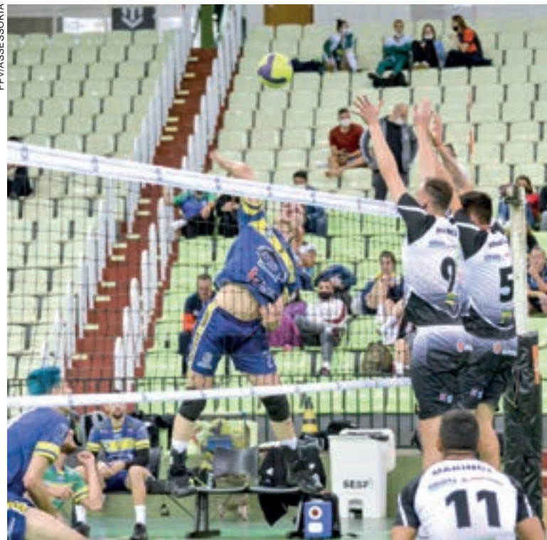
Cascavelenses não se deram bem em Maringá

No masculino, o confronto foi mais equilibrado e terminou com vitória do AMVP/Dom Bosco/CooperCard, por 3 a 2 (23/25, 20/25, 25/21, 25/23 e 15/09), resultado que manteve os maringenses no topo da tabela com 12 pontos e os cascavelenses na vice-liderança.