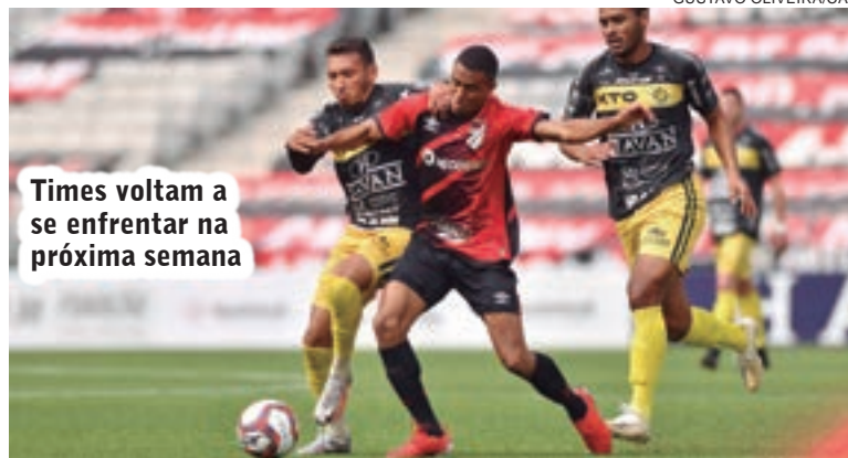
Times voltam a se enfrentar na próxima semana

Os dois times voltam a se enfrentar na próxima quarta-feira, no Estádio Olímpico.