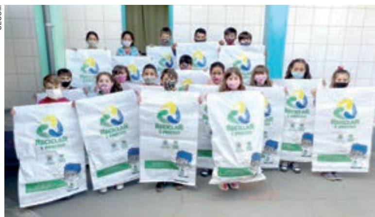
Alunos do 2º ano aprenderam a separação correta de resíduos domésticos

O Programa Reciclar é Preciso conta com estrutura de coleta de sete caminhões e 23 coletores de empresas terceirizadas, que realizam o trabalho em 33 setores. Os materiais recicláveis são distribuídos para os cinco Ecopontos, sendo triados e comercializados pelas cooperativas