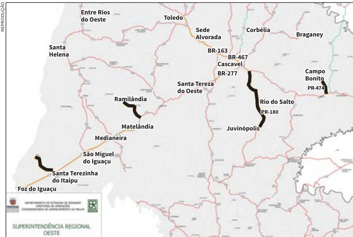
Lote cinco: Rodovias da região oeste que serão contempladas com a manutenção

A Câmara de Foz do Iguaçu irá enviar uma Moção de Apelo ao Senado solicitando ao presidente Rodrigo Pacheco (DEM) a retirada da pauta de votação do projeto de lei que muda o nome da Ponte da Integração para Ponte Jaime Lerner. A mudança de nome foi aprovada no mês passado pela Câmara dos Deputados a partir de um projeto do deputado federal Evandro Roman (Patriota-PR). Contudo, a população de Foz não quer a alteração do nome da segunda ponte que a ligará com o Paraguai e que está sendo construída pela Itaipu binacional.