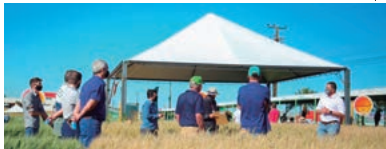
Evento segue até amanhã, no Centro Tecnológico Coopavel

O Show Rural Coopavel de Inverno, diante do que se vê aqui, cria um ambiente favorável para a utilização de áreas agricultáveis no inverno, o trigo se mostra como uma excelente opção, disse Ortigara. Ele falou dos desafios impostos pela pandemia nos últimos 18 meses e afirmou que o agro e a indústria fazem a sua parte no Paraná. “O campo cresceu em 21% no Estado, chegando a R$ 128 bilhões. Temos aqui a economia rural mais diversificada do País”, disse o secretário, falando das consequências do clima na quebra da produção de milho. “Mas os desafios nos impulsionam e saímos das crises ainda melhores”, destacou Ortigara, citando fala da ministra da Agricultura, Tereza Cristina, de que as perspectivas para o setor agropecuário são fabulosas para os próximos anos.