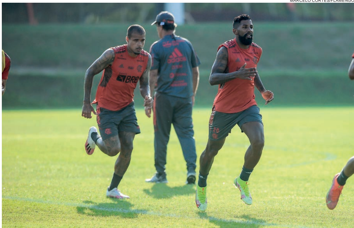
Fla joga para confirmar vaga na semifinal