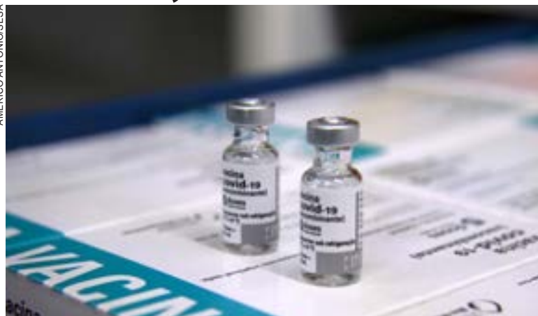
São 115.500 doses da AstraZeneca/Fiocruz e 209.430 da Pfizer/BioNTech

As doses serão encaminhadas para o Cemepar (Centro de Medicamentos do Paraná), em Curitiba, onde passarão por conferência e armazenamento até que sejam descentralizadas. A distribuição dos imunizantes para as 22 Regionais de Saúde está condicionada à