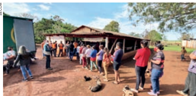
Serão entregues 1,2 mil cestas