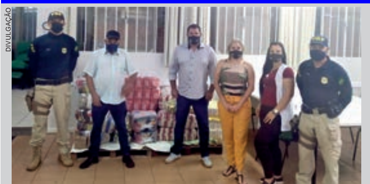
A PRF (Polícia Rodoviária Federal) repassou uma tonelada de alimentos para a Apae de Cascavel. A instituição esclarece que serviu apenas de intermediária, uma vez que a doação foi feita por empresários. As doações vão reforçar o cardápio nutricional dos alunos.