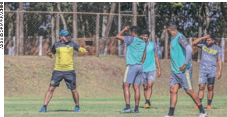
Treinos do FCC seguem no CT para o jogo de sábado

Enquanto aguarda a confirmação, o FC Cascavel segue trabalhando para a partida da volta contra o Cianorte, pela Série D. Com o empate na primeira partida, quem vencer o jogo do próximo sábado estará classificado para a terceira fase da competição.