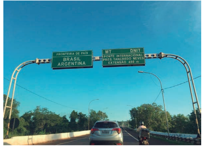
A quarentena não será mais obrigatória para argentinos

Apesar de a quarentena não ser mais necessária, os