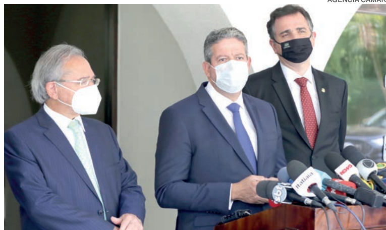
Guedes, Lira e Pacheco: “acordo” para os precatórios

“Que fique claro o respeito ao teto, ao pagamento dos precatórios que abrem caminho fiscal para a criação de um novo programa social, que é imperioso que seja esse ano. Devemos acertar os procedimentos na Câmara”, disse Lira, afirmando que vai conversar com os líderes sobre a possibilidade de dar mais celeridade à proposta na comissão e também no Plenário. Segundo ele, o importante