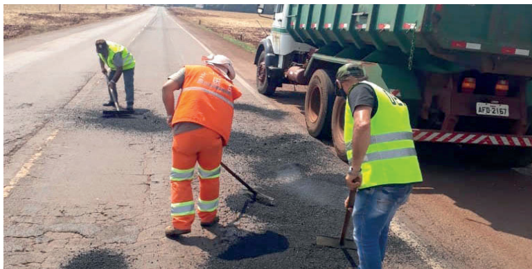
Primeiros trechos atendidos foram da PR-239 (Toledo/Assis) e PR-484 (Boa Vista/Capitão)

O departamento, então, optou por licitar um novo contrato de conservação, utilizando levantamentos atualizados e soluções mais modernas, que estão sendo trabalhadas para futuros programas de conservação. No dia 1º de