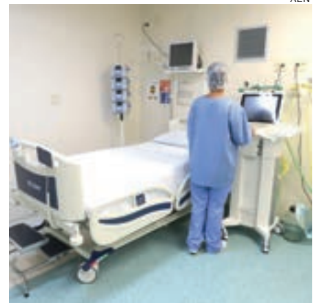
Redução no número de internamentos traz alívio ao sistema, mas não reduz complexidade da pandemia

Em relação à dose de reforço, ontem (8) foram vacinados os idosos com 60 anos ou mais. Um novo cronograma deverá ser divulgado na semana que vem. Vale lembrar que qualquer cidadão que procurar as unidades de saúde, seja para 1ª, 2ª ou 3ª dose (reforço), é necessário apresentar documentos.