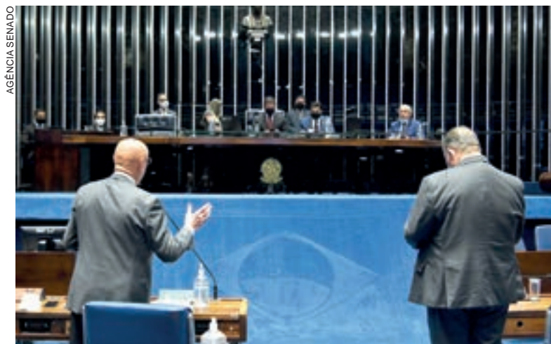
Texto sobre propaganda partidária gratuita foi alterado na Câmara e agora será analisado outra vez pelos senadores

O tempo é assegurado para inserções nas redes nacionais e em igual quantidade nas emissoras estaduais. Em cada rede, poderá haver apenas dez inserções de 30 segundos por dia. A cláusula de desempenho estipula que somente terão direito ao dinheiro do Fundo Partidário e ao acesso gratuito ao rádio e à televisão os partidos com um mínimo de votos distribuídos por 1/3 dos estados ou um número mínimo de deputados