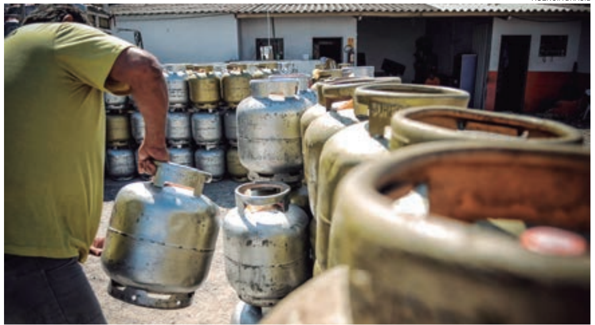
Na refinaria, o botijão de gás de 13 quilos sai R$ 50,15

Na semana passada, a estatal subiu o preço do diesel em 8,9%, no primeiro reajuste depois de 85 dias. A escalada dos preços dos combustíveis