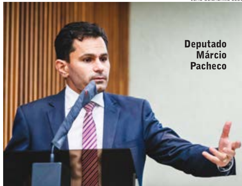
Deputado Márcio Pacheco

O deputado ainda disse que o projeto vem sofrendo muitas críticas, além disso, a possível ADI (Ação Direta de Inconstitucionalidade) contra o projeto não preocupa Pacheco. "Eu acredito firmemente que a nossa lei prosperará e se manterá firme como foi aprovada. [...] Tem sido uma prática em todo o Brasil, porque quem se opõe a esse projeto, de maneira especial na Assembleia Legislativa, o