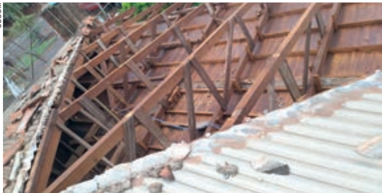
Em caso de destelhamentos, a orientação é acionar de forma imediata a Defesa Civil pelo 199

Óbitos registrados ontem, até às 17h, pela Acesc, em Cascavel