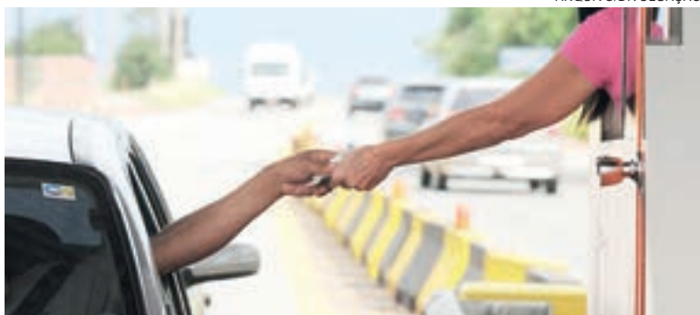
Marca dos R$ 2 bi foi alcançada em “tempo recorde”, mesmo com a crise econômica gerada pela pandemia

Criado com anos de atraso, já que o sistema de controle era previsto no início da concessão, há 24 anos, o pedagiômetro é alimentado atualmente com informações de todas as seis concessionárias. A Econorte, responsável pela administração do lote 1, não divulgava os dados de arrecadação há mais de dois anos por conta de uma disputa judicial,