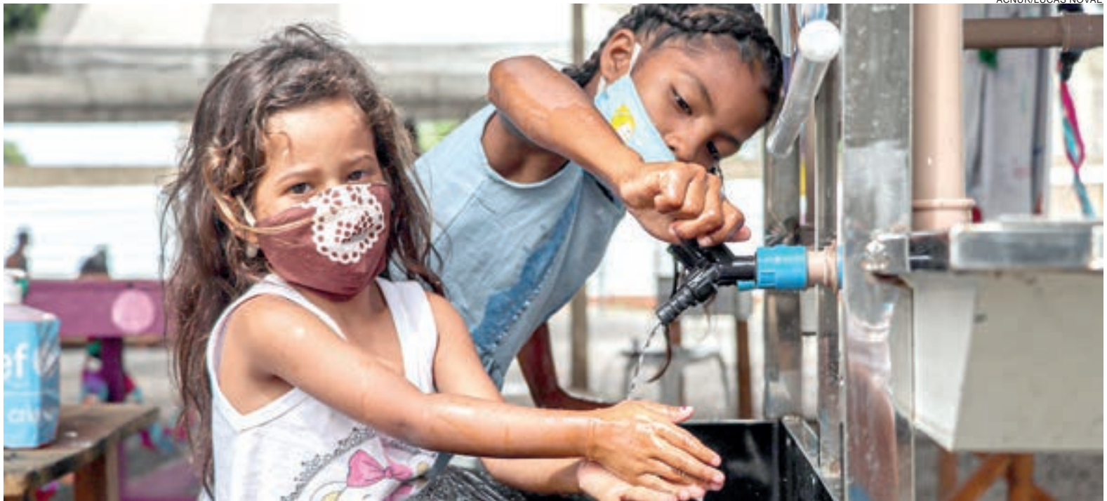
Pais e responsáveis devem ficar atentos a todos os sintomas apresentados pelas crianças

Além das prevenções que já estamos acostumados, um aspecto que é necessário ficar atento é o ambiente. Para evitar a infecção, deve-se preferir