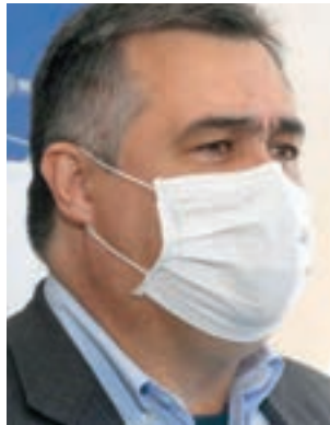
Secretário de Saúde do Paraná, Beto Preto, reiterou que o uso de máscara segue obrigatório no Paraná