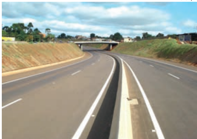
Já duplicado com recursos público, trecho da BR-467, entre Cascavel e Toledo tem pedágio confirmado pela ANTT

O contrato será de 30 anos. Vence o leilão quem apresentar o maior desconto sobre a tarifa