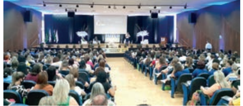
Seminário em Cascavel é o primeiro evento presencial da Undime-PR desde o início da pandemia