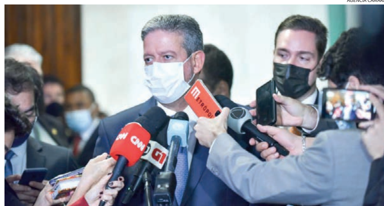
Lira garantiu que partes que interessam ao Auxílio Brasil serão promulgadas

A votação da medida foi uma resposta do Congresso à decisão do STF (Supremo