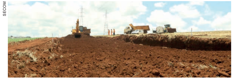
Na Avenida das Torres, 25% dos trabalhos de terraplanagem já estão concluídos

A obra contempla também um viaduto para o acesso a Estrada Chaparral com um custo de cerca de R$ 3 milhões. As obras devem começar até a metade deste mês de dezembro e a previsão de entrega é para maio do próximo ano.