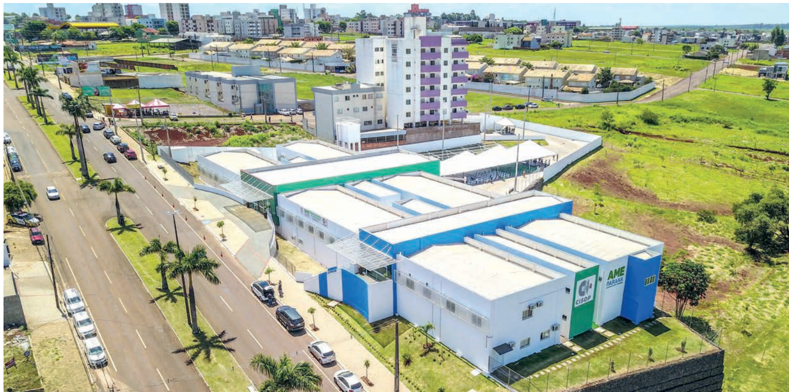
A nova sede do Cisop, localizada na Avenida Brasil, Bairro Santa Cruz, iniciará atendimento efetivo no dia 3 de janeiro

A estrutura conta ainda com atendimento materno-infantil, anfiteatro de 200 lugares, um centro de distribuição de medicamentos e consultórios equipados com tecnologia de ponta para realização