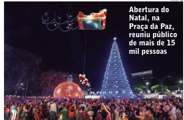
Abertura do Natal, na Praça da Paz, reuniu público de mais de 15 mil pessoas

Também estão programadas apresentações do cantor Daniel, no dia 19, e do padre Reginaldo Manzotti, em 22 de dezembro, ambos no Gramadão. Todas as atrações são gratuitas. Ao longo da programação, haverá coleta de alimentos não perecíveis para quem puder doar.