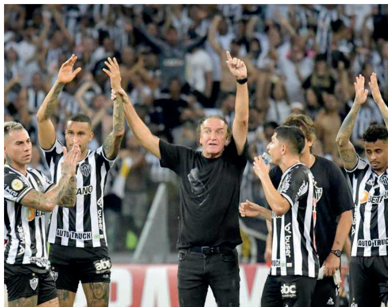
O paranaense Cuca é o comandante do Galo campeão

A comemoração foi marcada pelo desfile em carro aberto dos campeões brasileiros e de uma festa que reuniu milhares de atleticanos na Praça Sete, na região Central de Belo Horizonte.