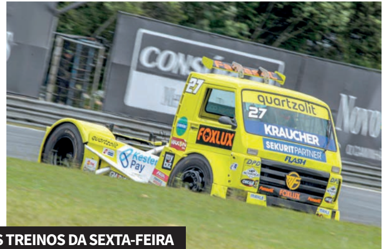
Fábio Fogaça fez o melhor tempo da categoria Super Truck

O grid de largada da etapa de encerramento da temporada será definido a partir das 13h deste sábado. Neste domingo, a corrida 1 tem largada às 11h08 e a 2 às 11h43.