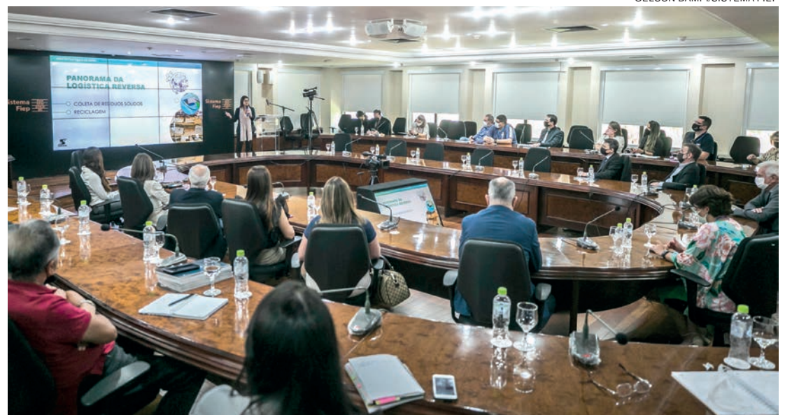
Rota Estratégica apresenta ações para impulsionar logística reversa no setor do papel