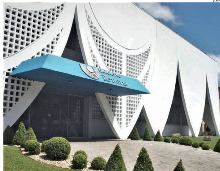
Paraná conta com sete universidades estaduais: UEL, UEM, Unioeste, UEPG, Unicentro, Uenp e Unespar