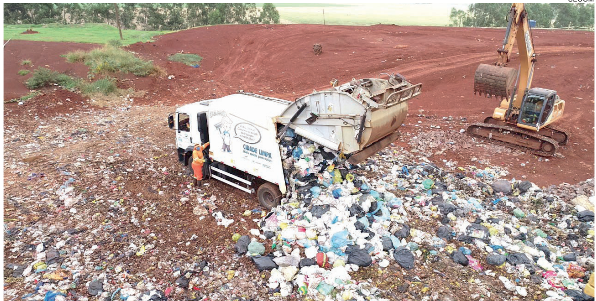
Serviços de coleta de lixo tem custo mensal de R$ 3,3 mi e será prorrogado por 180 dias até que a nova licitação seja concluída