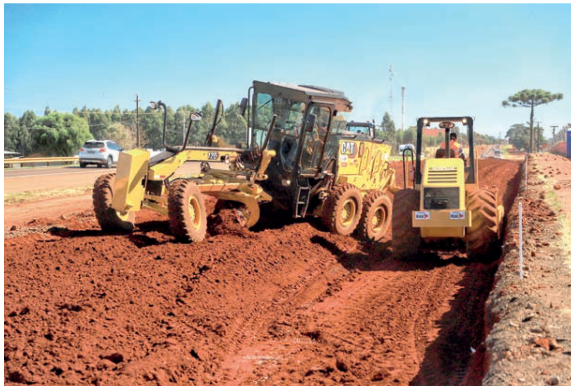
Em Cascavel, seguem as obras de duplicação de trecho da BR-277

O maior valor ficou para o novo Programa de Segurança Viária das Rodovias Estaduais (Proseg Paraná) do DER/PR, que estimou um investimento de R$ 457 milhões para atender 9.965,43 quilômetros de rodovias com serviços de sinalização horizontal e vertical, instalação de dispositivos