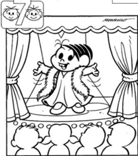
O NOVO ESPETÁCULO QUE A MÔNICA VAI APRESENTAR É IDENTIFICAR OS SETE ERROS ENTRE OS DESENHOS. VAMOS LÁ?