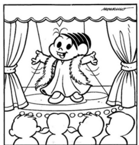
RESP.: 1- TÓPO DA CORTINA, 2- BARRA DA CORTINA, 3- CABELO DA MENINA NA PLATAFORMA, 4- GOLA DO VESTIDO DA MÔNICA, 5- SAPATO DA MÔNICA, 6- LUZINHA NO CILÍNDRICO, 7- ESTOLA DA MÔNICA, 8- DÍGITO DA MÃO DA ESQUERDA.