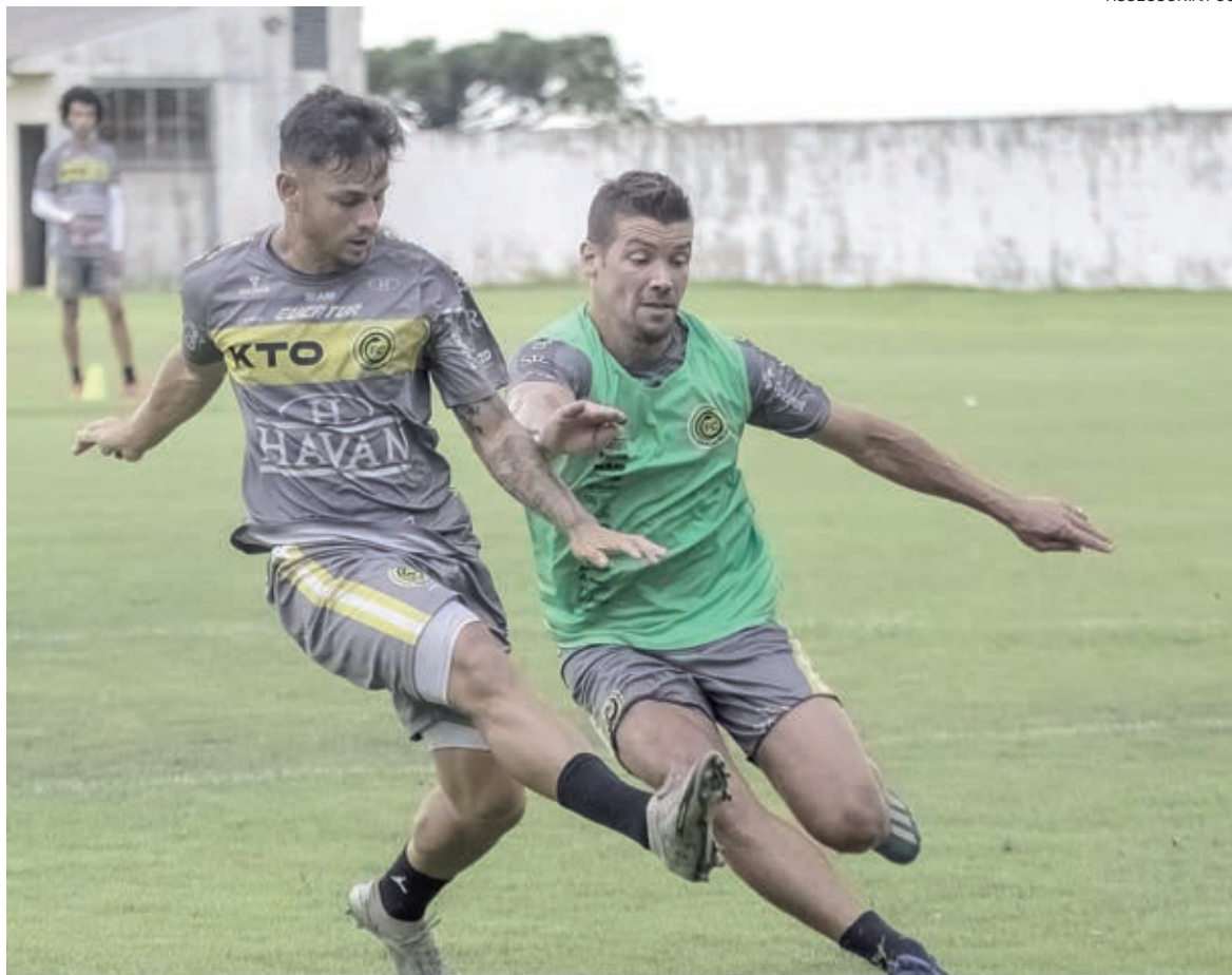
Time terá formação alterada mais uma vez para tentar vencer fora de casa