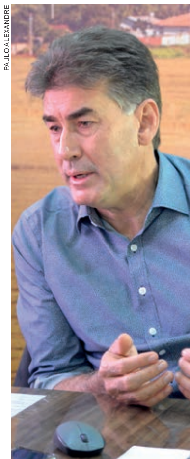
Leonaldo Paranhos, prefeito de Cascavel e presidente da Amop

De acordo com o prefeito de Cascavel e presidente da Amop, Leonaldo Paranhos, existe uma preocupação por parte dos prefeitos em dar andamento a esses projetos, para que possam estar viabilizados no prazo legal. “É uma preocupação que a gente tem. Primeiro com a importância de