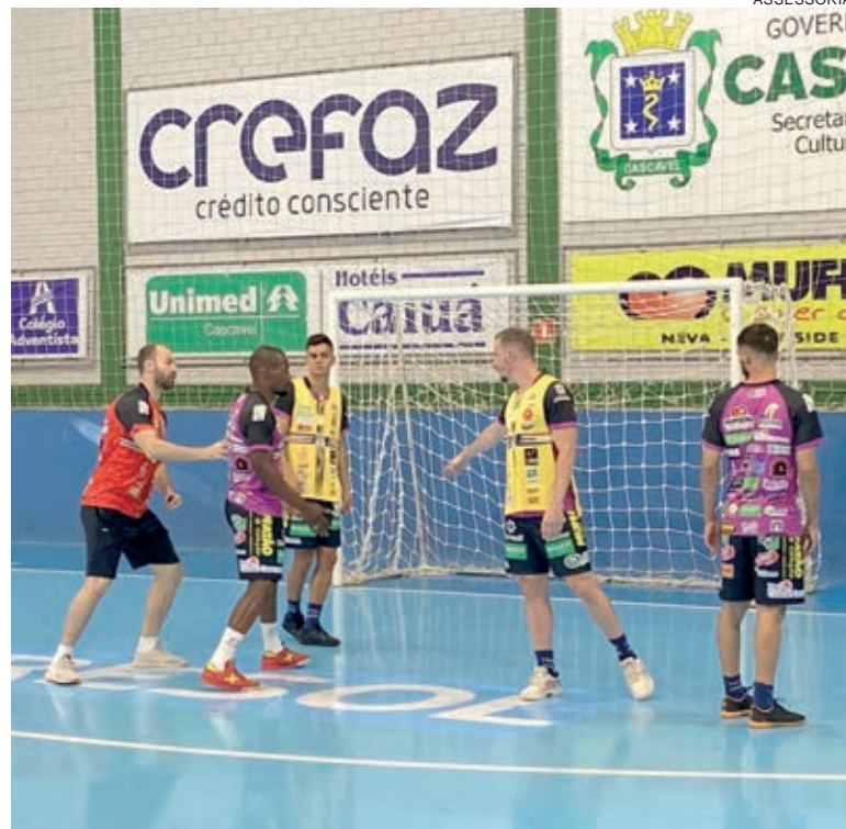
Time segue treinando à espera da estreia

Duas cidades paranaenses foram confirmadas como sede da Taça Brasil para categorias de base. A CBFS decidiu desmembrar as competições em par e ímpar, conforme a idade dos atletas. Assim, Chopinzinho vai receber competições sub-17 e sub-15 feminino a partir de 10 de abril; e a Taça Brasil Sub-20 masculina, a partir de 15 de maio. Em Palmas acontece a Taça Brasil Sub-12 Masculino entre os dias 7 e 14 de agosto.