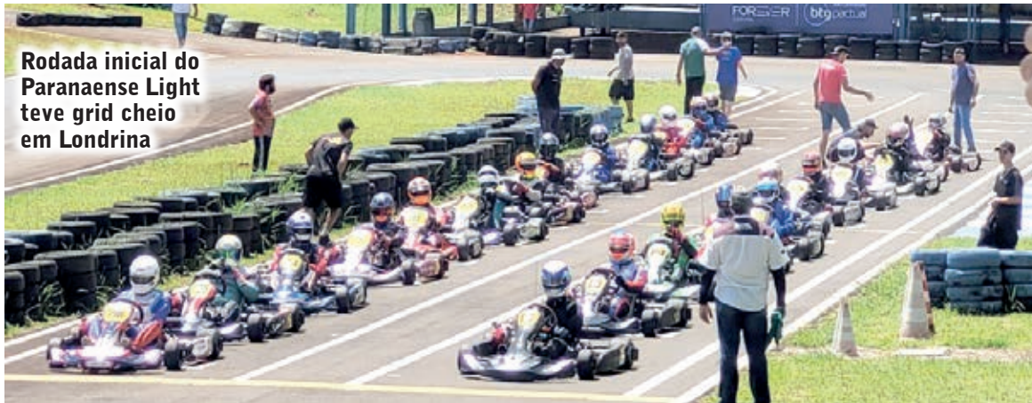
Rodada inicial do Paranaense Light teve grid cheio em Londrina

A rodada inicial da competição, organizada pela Associação de Kartistas da Região de Londrina (AKRL) e supervisionada pela FPrA (Federação Paranaense de Automobilismo), foi disputada no mesmo sistema utilizado na Copa Brasil. Após a tomada de tempos os pilotos foram à pista para duas provas classificatórias, que definiram o grid