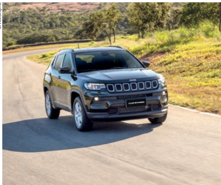
Commander alcança sua melhor participação de mercado no segmento de D-SUVs