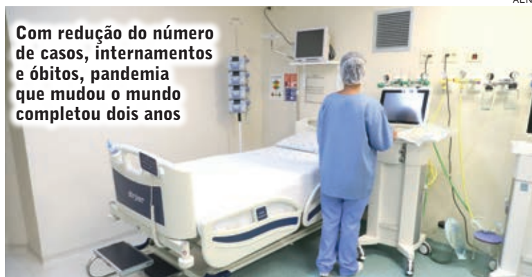
Com redução do número de casos, internamentos e óbitos, pandemia que mudou o mundo completou dois anos

A última variante que enfrentamos e a com a maior incidência de transmissibilidade