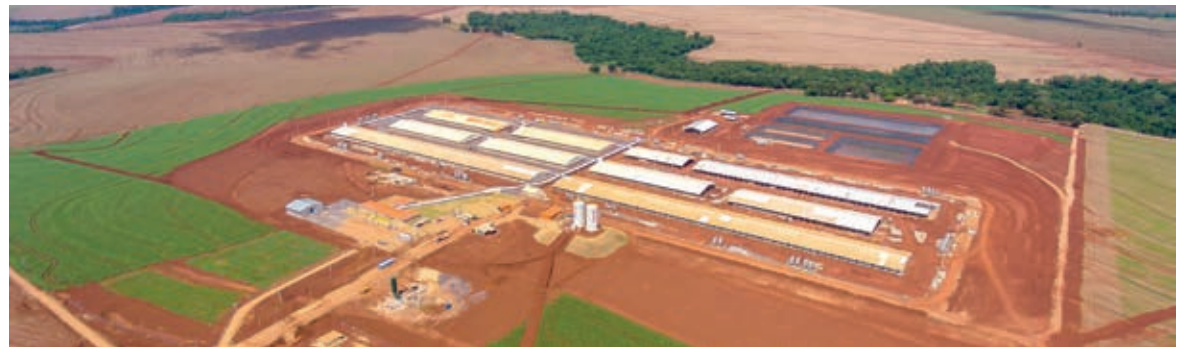
Estrutura fica entre Jesuítas e Iracema do Oeste

Com o que há de mais moderno, a UPD da Copacol se destaca pela tecnologia: barracões climatizados,