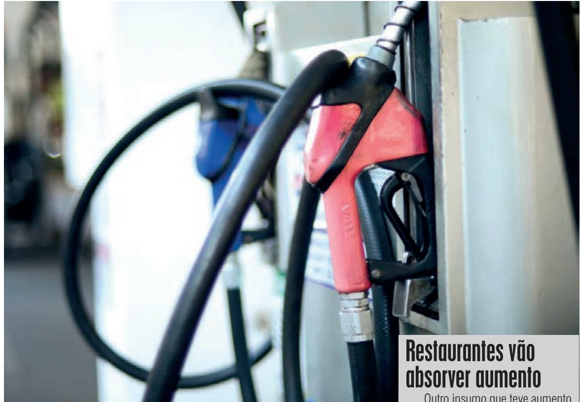
Reajuste na bomba provoca aumento em vários setores, numa pressão direta no índice inflacionário

De acordo com o Conet, foram apurados índices a serem aplicados no serviço de cargas fracionadas (18,58%) e na carga lotação (27,65%). O aumento do preço do diesel, da ordem de 24,9%, acarreta a necessidade de reajuste adicional no frete de, no mínimo, 8,75%, fator este que deve ser aplicado emergencialmente nos fretes, acumulando um reajuste total de 28,96% na carga fracionada e 38,82% na carga lotação.