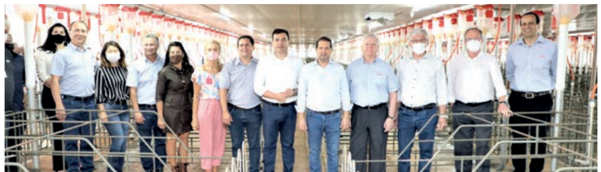
Autoridades conheceram nova estrutura da UPD

Com o que há de mais moderno, a UPD da Copacol se destaca pela tecnologia: barracões climatizados, alimentadores automáticos, estruturas de maternidade com regulagem conforme o tamanho do suíno, embarcadores são movimentados por sistema hidráulico, sistema de lavagem pressurizada, com água quente para higienização completa e desinfecção das maternidades.