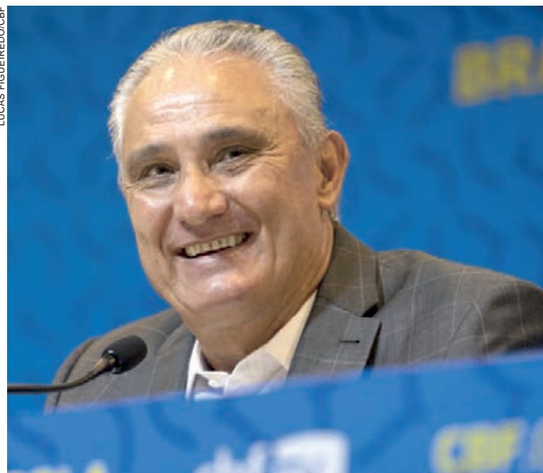
LÍDER nas Eliminatórias com 39 pontos, o Brasil já está classificado para a Copa do Mundo

Os 25 atletas defenderão o Brasil nas partidas contra Chile e Bolívia, pelas próximas rodadas da competição. A Seleção Brasileira enfrenta o Chile no dia 24 de março, no Maracanã, e encara a Bolívia, no dia 29, em La Paz.