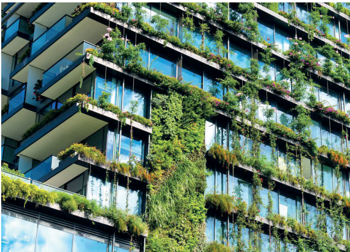
Curso é destinado a arquitetos e demais profissionais de edificações

Aos profissionais da área de edificação, a Universidade Paranaense – Unipar lança a pós-graduação em Projeto Arquitetônico: Prática, Técnica e Contemporaneidade. O curso está previsto para iniciar em abril, na Unidade de Cascavel.