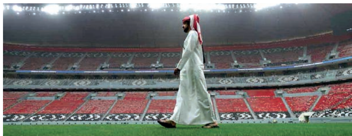
Moderno, o estádio Al Bayt será um dos palcos da disputa no Catar

Com o resultado, a seleção chegou a 21 pontos, contra 15 dos australianos. Como tem 19 e faltará apenas uma rodada, a Arábia Saudita não precisa mais pontuar para se garantir