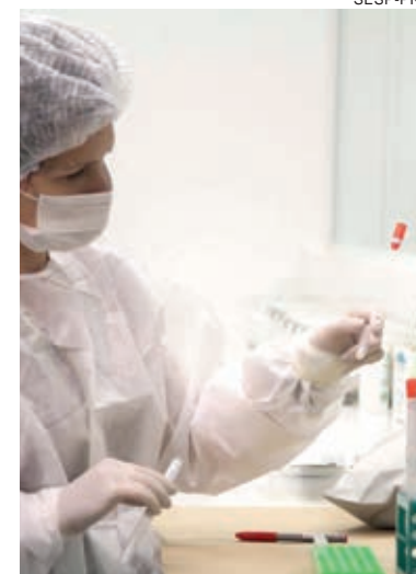
Polícia Científica conclui compromisso de processar 2 mil amostras de DNA de crimes sexuais

“O laboratório tem uma equipe empenhada que abraçou essa causa. É a oportunidade que nos foi concedida de poder colocar em prática o