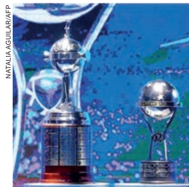
Palmeiras e Athletico são os atuais campeões das competições continentais

outras quatro juntam-se a esta fase por terem caído na terceira fase da Libertadores. Sete times brasileiros estarão na fase de grupos. São eles: Santos, São Paulo e Internacional no Pote 1. Atlético-GO e Ceará (Pote 3), Cuiabá e Fluminense (Pote 4). A final da competição será disputada no dia 1º de outubro de 2022, no Estádio Nacional Mané Garrincha, em Brasília.