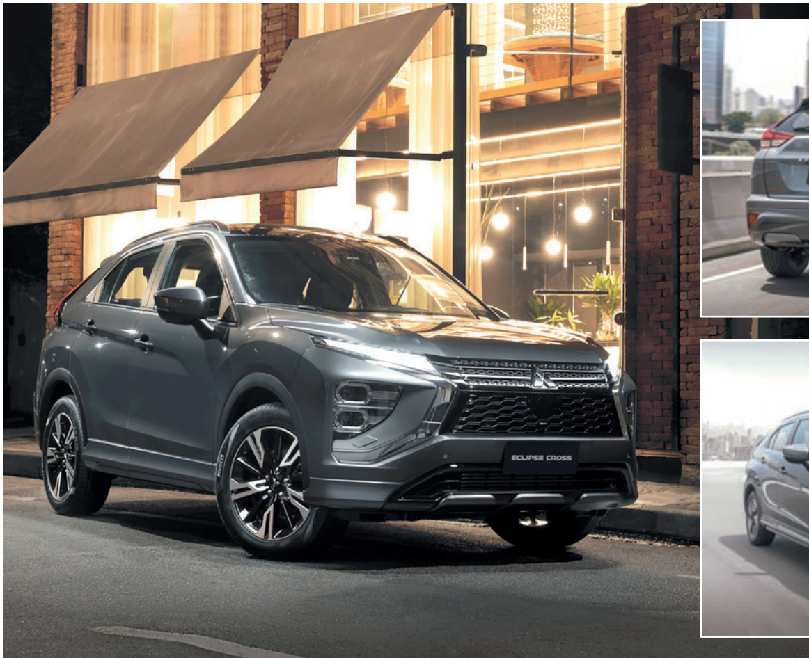
Novo Eclipse Cross 2023, SUV com legítimo DNA 4X4 da Mitsubishi chega com novo design, mais capacidade de porta-malas e mais opções de acabamento