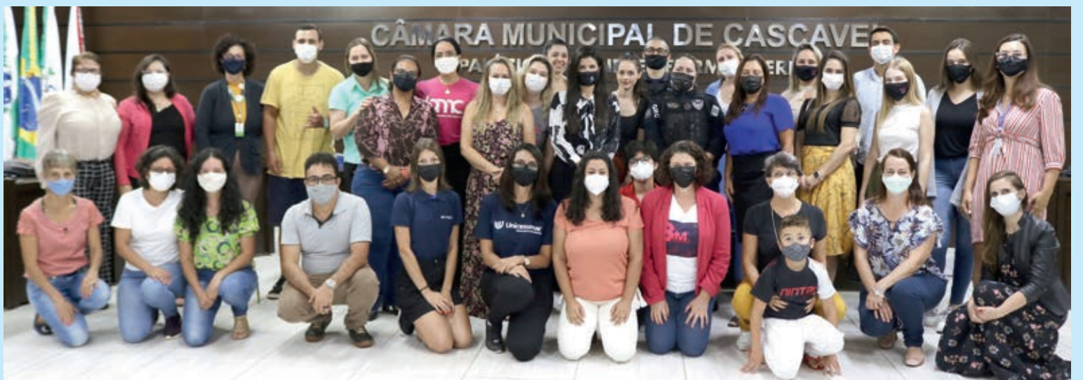
O Projeto Combate à Violência Contra Mulher: Aspectos Físicos e Psicológicos do Centro Universitário de Cascavel - Univel, foi convidado para o Painel Expositivo promovido pela Câmara Municipal de Cascavel. O evento tinha como propósito divulgar projetos e ações realizadas no município e voltadas em prol das mulheres.