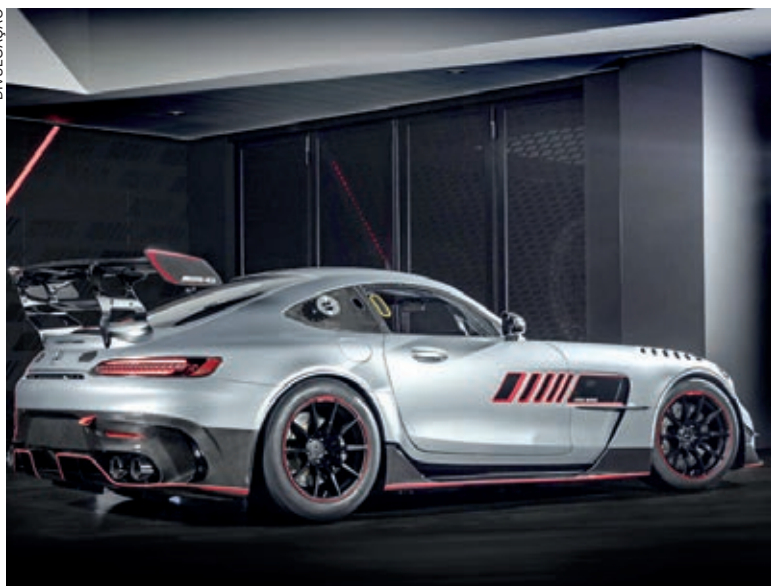
Esportivo é desenvolvido para ser utilizado somente em pistas de corrida, especialmente em Track Days