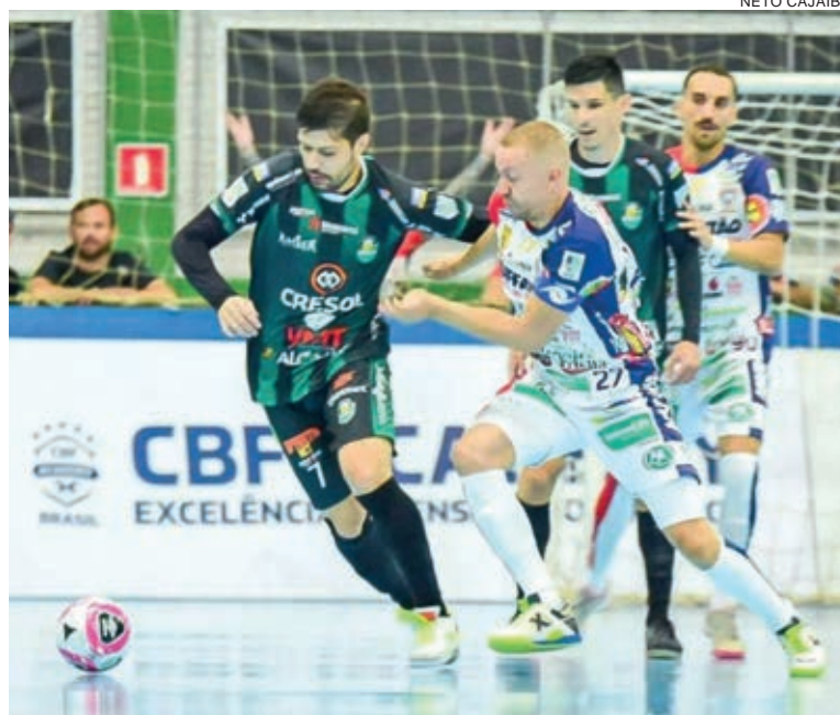
Cascavel Futsal quer manter a Neva como o caldeirão

A partir de hoje acontecem os jogos da segunda rodada, com Marreco e Taubaté. A partir de sexta-feira jogam Minas x Tubarão, Jaraguá x Magnus, Corinthians x Marechal, Umuarama x Cascavel, Santo André x ACBF, Blumenau x Foz Cataratas, Atlântico x São José, Assoeva x Joaçaba, Praia Clube x Campo Mourão e Pato x Joinville.