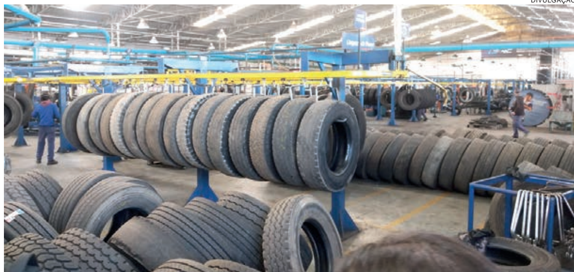
Para recapar um pneu é necessário apenas de 25% da matéria-prima para fabricação de um novo e diminui a emissão de CO 2 na mesma proporção

novos, existe uma demanda média de 57 litros de petróleo, e a emissão de cerca de 26 kg de CO 2 na atmosfera. Já para reforma do mesmo pneu e com desempenho semelhante, a necessidade é apenas de 25% da matéria-prima, e diminuição da emissão de CO 2 na