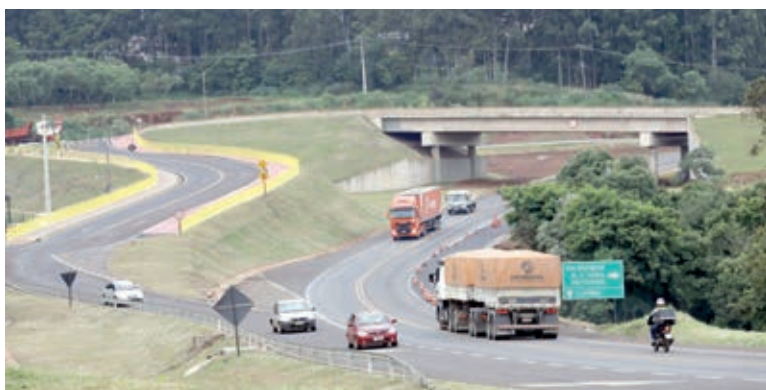
Alças do Viaduto Olindo Periolo serão entregues na tarde desta quinta-feira (31)

Uma das alças vai permitir o acesso aos bairros Presidente e Cascavel Velho pela Rua Áustria, para quem está seguindo