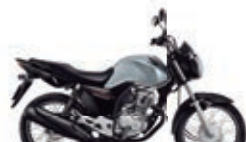
3º Prêmio: Motocicleta CG 160cc START - Ano/Modelo 2022