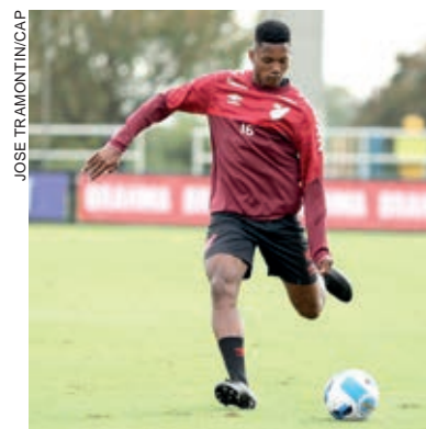
Fase de grupos começa hoje para o Athletico-PR