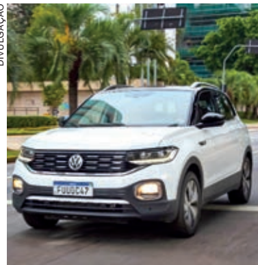
O T-Cross é líder geral em vendas no varejo em março, emplacando 5.390 unidades

O Volkswagen T-Cross está fazendo história! Em março, foi o carro mais vendido no varejo do Brasil, considerando todos os concorrentes de todos os segmentos do mercado brasileiro! O SUVW conquistou a liderança no consolidado de vendas no varejo, ao emplacar 5.390 unidades no mês passado. O feito reforça a preferência do consumidor brasileiro pelo modelo, que é referência em performance, espaço interno, conforto e