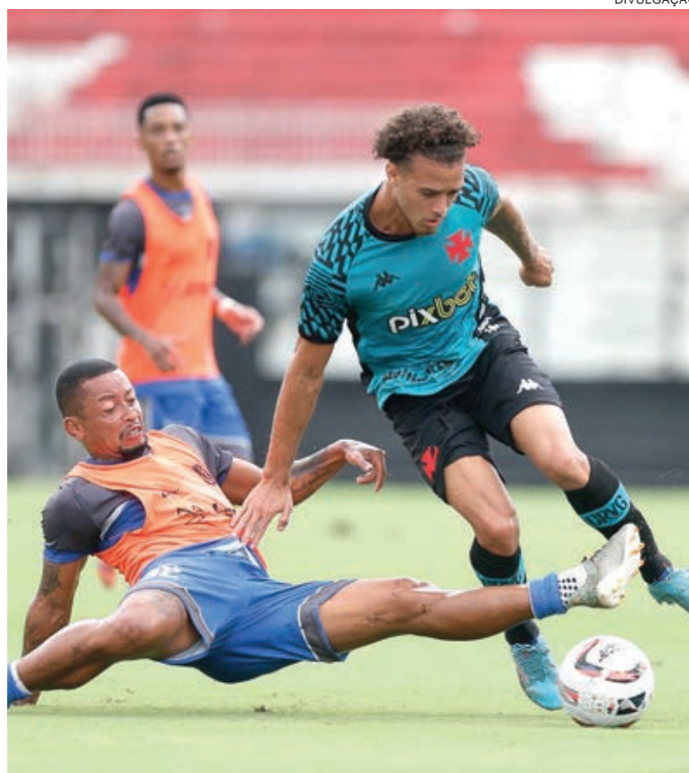
Vasco estreia na busca pelo retorno à elite

Na tentativa de sair das dívidas e com a parceria de Ronaldo, o Cruzeiro precisa se remontar para encarar a Série B. A estreia, hoje, será em Salvador contra o Bahia. Até ontem, a diretoria corria para que os novos contratados tenham condições de jogar na partida de logo mais.