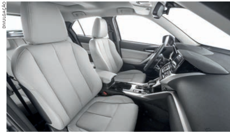
Nas versões HPE-S, S-AWC e HPE, os bancos dianteiros contam com ajuste elétrico e sistema de aquecimento para os dias de temperaturas baixas

permite aos clientes abrir e fechar o veículo somente por meio da aproximação da chave, que pode permanecer no bolso ou na bolsa. Para entrar no veículo, basta se aproximar – tendo a chave com você – e apertar um botão na maçaneta da porta do motorista.