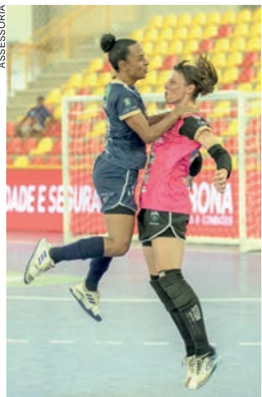
Meninas garantiram vitória na estreia da competição nacional

Cascavel - As meninas do Stein Cascavel Futsal iniciaram a temporada 2022 com vitória. Na abertura da Liga Feminina de Futsal, o time bateu o Female (SC), por 2 a 0, com gols de Michi e Camila. Toda a rodada da competição foi disputada na cidade de Sorocaba. Agora, as meninas iniciam a preparação para o jogo contra o Telêmaco Borba, dia 23, no Ginásio da Neva, repetindo a final do campeonato estadual. Nas outras partidas da rodada de abertura, o Taboão da Serra goleou o Adef/Brasília, por 13 a 1 e o Telêmaco Borba goleou o Cianorte por 7 a 1. As meninas do Barateiro de Santa Catarina estrearam perdendo para o São José de São Paulo por 3