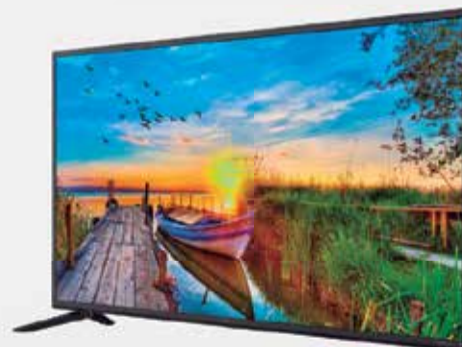
4º Prêmio: Televisor 43'