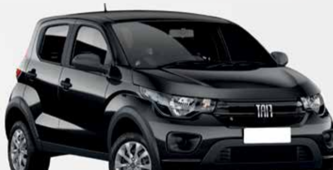
2º Prêmio: Fiat Mobi EASY 1.0 FLEX MANUAL, Ano 2021, Modelo 2022