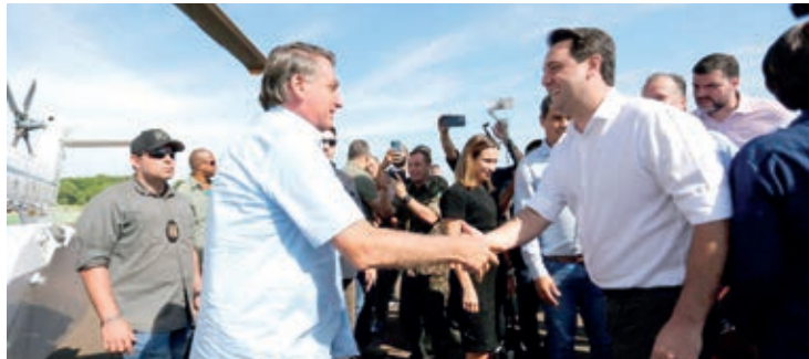
Ratinho Junior visitou, ao lado do presidente Bolsonaro, o Santuário de São Miguel Arcanjo, em Bandeirantes