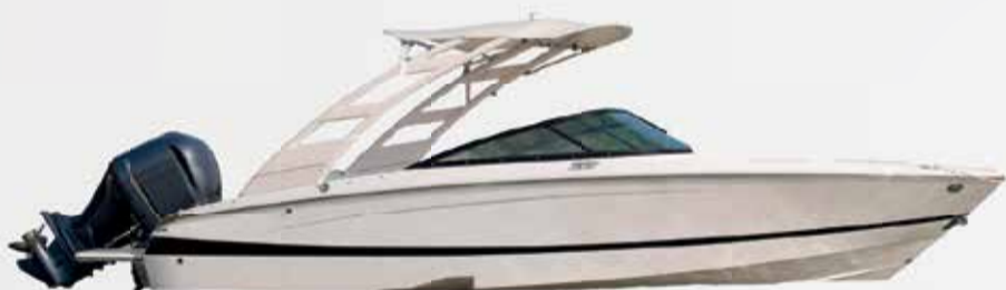
1º Prêmio: Lancha motorboat Evinrude 225

Sorteio 30/11/2022 pela extração da Loteria Federal