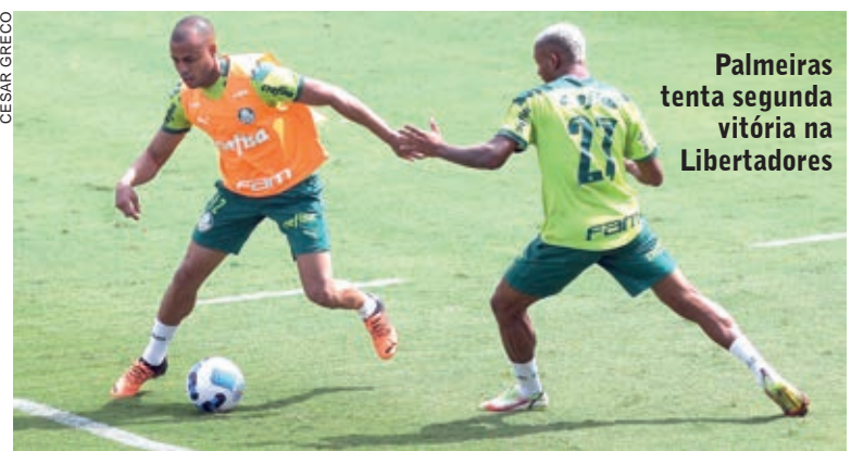
Palmeiras tenta segunda vitória na Libertadores

A tendência é de que o time seja: Weverton; Mayke, Kuscevic, Murilo e Piquerez; Danilo, Atuesta e Raphael Veiga; Dudu, Wesley e Gabriel Veron. Jailson, expulso na goleada sobre o Deportivo Táchira, na Venezuela, é desfalque.