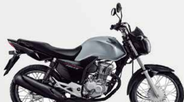
3º Prêmio: Motocicleta CG 160cc START - Ano/Modelo 2022