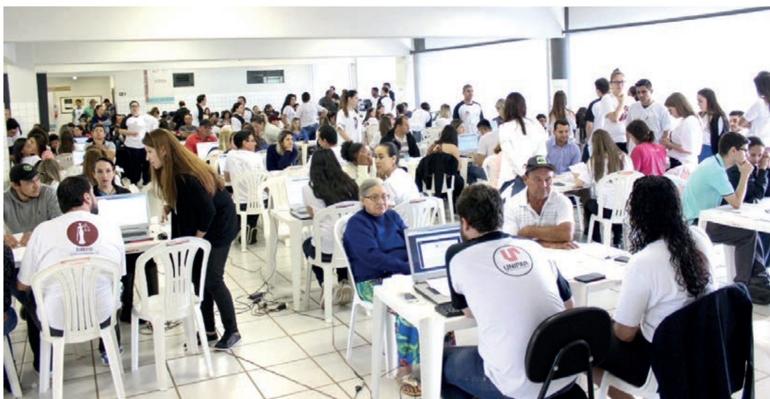
Mais de 10 mil casos foram atendidos em cada edição

O pronto atendimento será nas áreas Cível (Curatela), Família (Alimentos, Exoneração de Alimentos, Guarda, Regulamentação de Visitas,