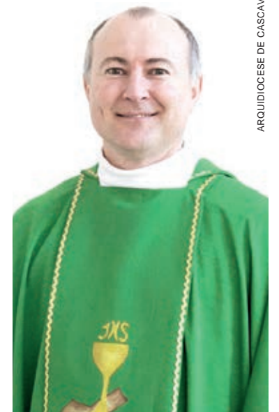
ARQUIDIOCESE DE CASCAVEL