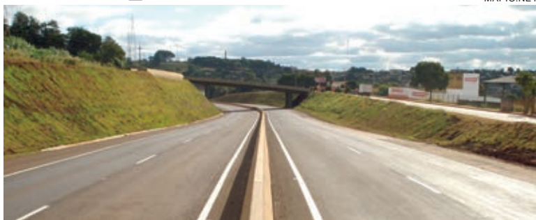
Vale lembrar que a BR-467, entre Cascavel e Toledo já foi duplicada com recursos do Governo do Estado

A ANTT (Agência Nacional de Transportes Terrestres) já chegou a informar que somente essa praça iria gerar sozinha 31% do valor total do lote. Porém, de acordo com o estudo elaborado pelo ITTI (Instituto de Tecnologia de Transportes e Inovação), da Universidade Federal do Paraná, nessa praça, o total de km pagos pelos usuários de todas as categorias será 20% superior ao total de km percorridos na malha de cobertura