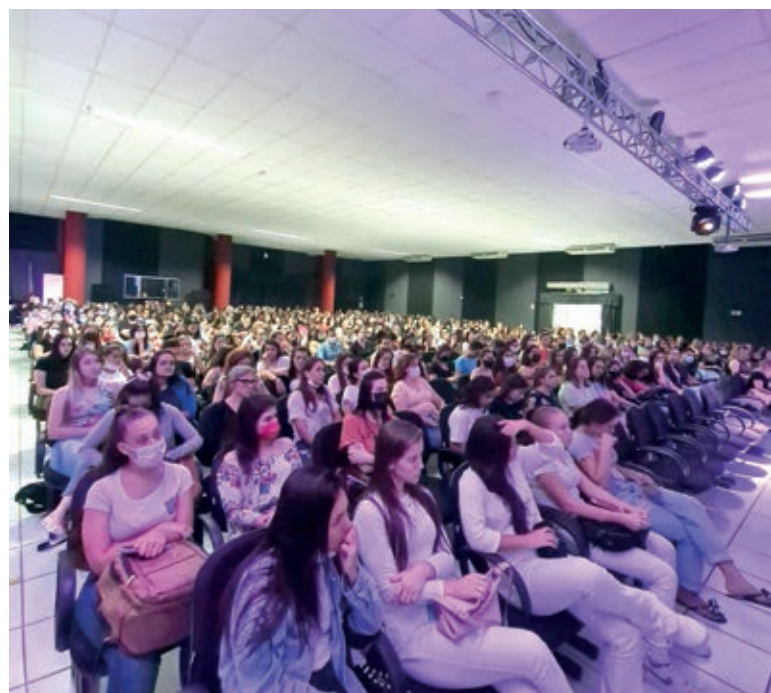
Acadêmicos da Saúde se reúnem em Aula Magna

Sua fala apresentou o contexto do processo de enfrentamento da covid-19 no