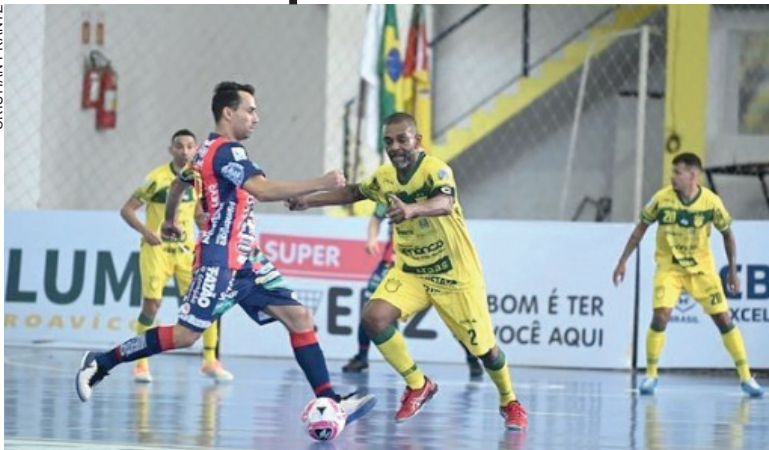
Cascavel sofreu nova derrota na liga Futsal

Cascavel – Há muito tempo o Cascavel Futsal não tinha uma sequência de jogos com resultados negativos e com motivos para preocupar a comissão técnica. Apesar de manter a liderança da Série Ouro, o time despencou para a nona colocação da Liga Futsal com dois resultados negativos em sequência para times que ainda estão no fundo da tabela e uma campanha com 50% de aproveitamento.