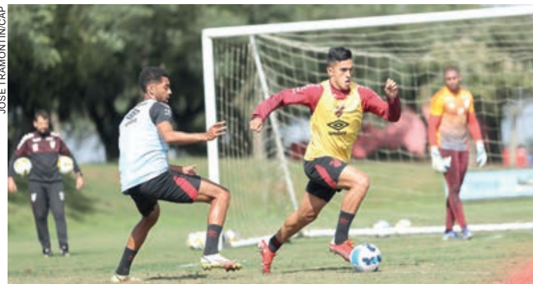
Rubro-negro encara Libertad no Defensores del Chaco