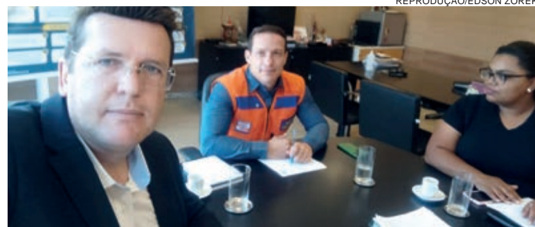
Em Brasília para Marcha dos Prefeitos, secretários de Cascavel aproveitam para percorrer ministérios