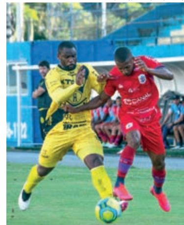
O empate foi considerado um bom resultado e manteve Cascavel na zona de classificação

terceira rodada do grupo 8 estão marcados para o próximo fim de semana, nos dias 30/04 e 01/05.