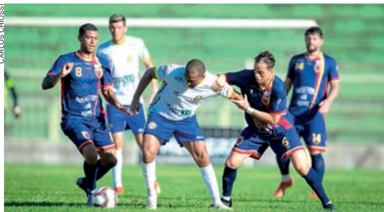
Toledo lidera a Divisão de Acesso

A quinta rodada será disputada no próximo final de semana com Foz x Andraus, Prudentópolis x Toledo, PSPTC x Aruko, Laranja Mecânica x Verê e Apucarana x Iguazu.