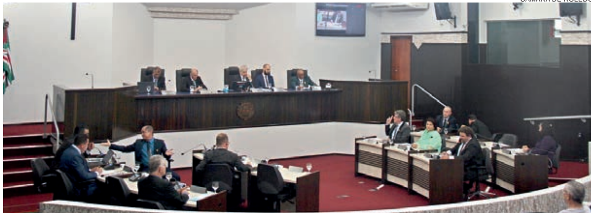
CÂMARA DE TOLEDO

Longo debate aqueceu o clima da sessão que acabou aprovando o reajuste que agora segue para sanção