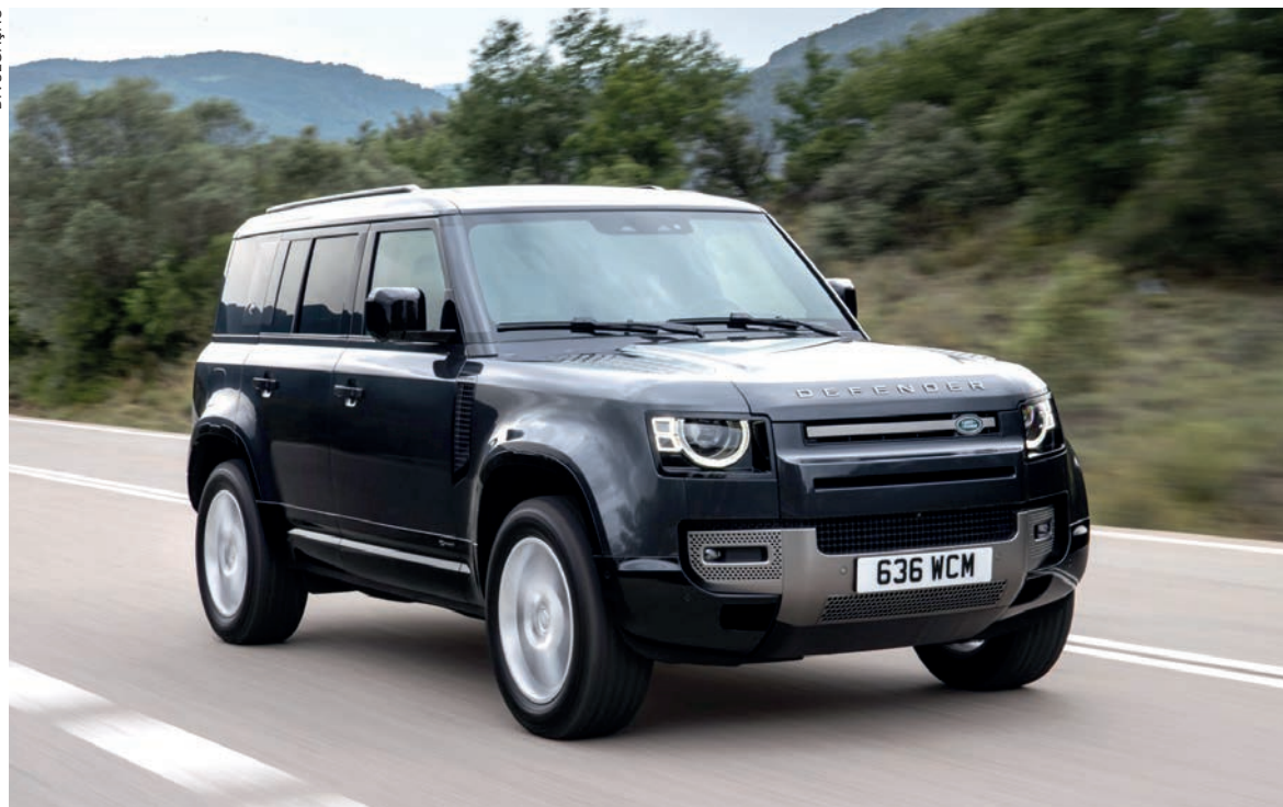
Sucesso de vendas em todo mundo, a linha Defender conta hoje no Brasil com as opções 110, extremamente versátil e com a opção de 7 lugares

O Novo Defender recebeu em sua nova versão a motorização Diesel MHEV, fazendo o equilíbrio perfeito entre potência para superar os mais variados terrenos e tecnologia para reduzir o consumo de combustível e emissão de CO2. O motor MHEV combina um motor a de 300cv com um alternador que também tem a capacidade de funcionar como motor elétrico. O alternador usa a rotação do motor para gerar corrente elétrica, e recupera energia quando o carro desacelera, carregando uma bateria de lítio de 48-volts instalada no veículo. Ao operar como um motor elétrico, ele utiliza essa energia da bateria