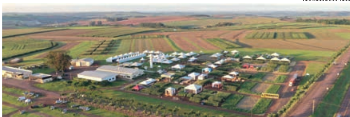
Copacol Agro 2022 terá mais de 80 expositores em uma área de 60 mil metros quadrados

A Suinocultura será evidenciada na quarta-feira, às