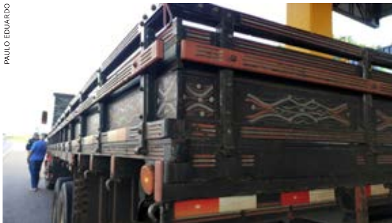
Caminhoneiros foram abordados em operação educativa e de fiscalização no posto da PRF na BR-277, em Cascavel

refletiva é um equipamento de uso obrigatório e caso esteja em más condições ou o caminhão esteja sem o equipamento, o condutor é enquadrado em multa grave, prevista no Artigo 230, inciso 9 e 10, no valor de R$ 195,23. “Por isso estamos aproveitando esse mês voltado as ações de conscientização no trânsito, para trabalhar o tema, na ação que tem cunho educativo e também de fiscalização”, salientou.