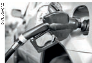
O combustível é o principal item da composição da inflação do carro

de cada peça ou serviço. Exemplo: para fazer a manutenção preventiva o motorista gasta R$ 58,00 de pneus por mês e R$ 90,00 de amortecedores. O segmento considerado para o estudo foi o dos carros compactos seminovos.