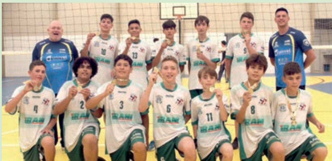
Colégio São Cristóvão foi campeão no vôlei

Novembro venceu no handebol masculino, o C.E. São Cristóvão foi o campeão no vôlei masculino para alunos com até 14 anos, e o C.E. Wilson Jofre foi o campeão no vôlei feminino para alunas até 17 anos.