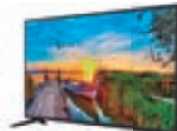
4º Prêmio: Televisor 43"