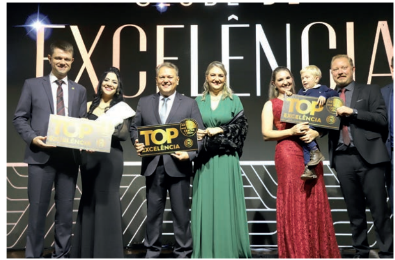
Diretores das Cooperativas Top Excelência 2020

Além do momento para as cooperativas, o evento também teve a premiação aos Inspiradores do Ano, projeto desenvolvido