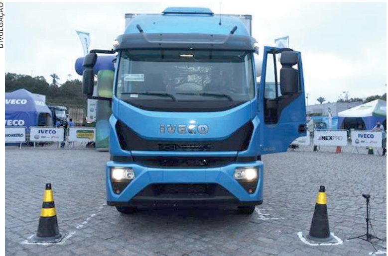
O campeão da Gincana do Caminhoneiro receberá como prêmio um Iveco Tector zero km

apresentar um comprovante de consumo de R$ 1.000,00 em diesel ou ter adquirido um balde de óleo Lubrax Top Turbo / Top Turbo Pro, Avante ou Extremo HD nos postos da Rede Siga Bem. O cupom pode ter sido emitido até sete dias