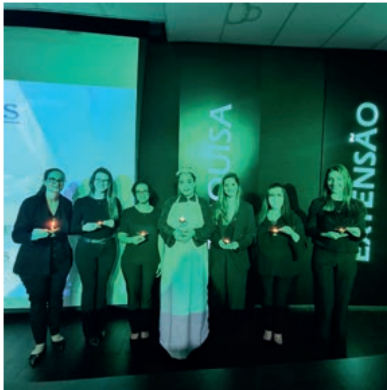
Professora conduzem ritual da Florence Nightingale

Outro momento aguardado foi a Passagem da Lâmpada,