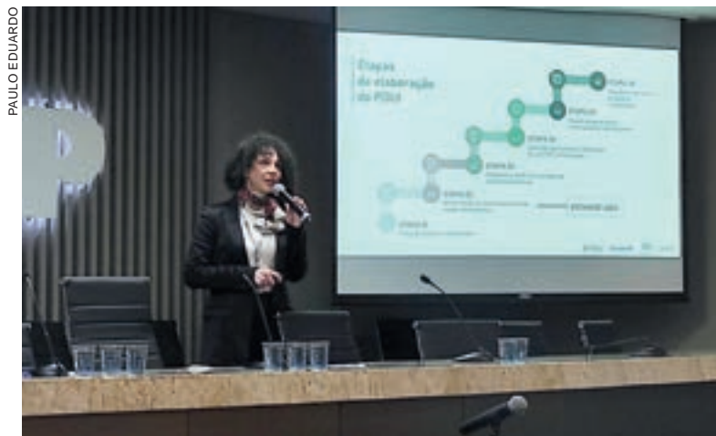
Reunião realizada ontem foi a primeira etapa do processo da Região Metropolitana de Cascavel

Até que todo o processo esteja concluído, os municípios ainda podem desistir da proposta ou ainda outras cidades não incluídas na lista