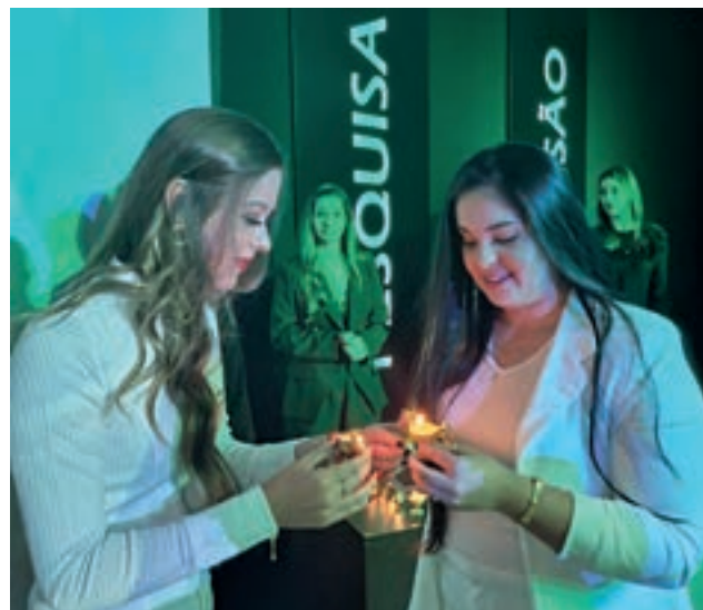
Alunos do 4º ano recebem a lâmpada dos colegas formandos