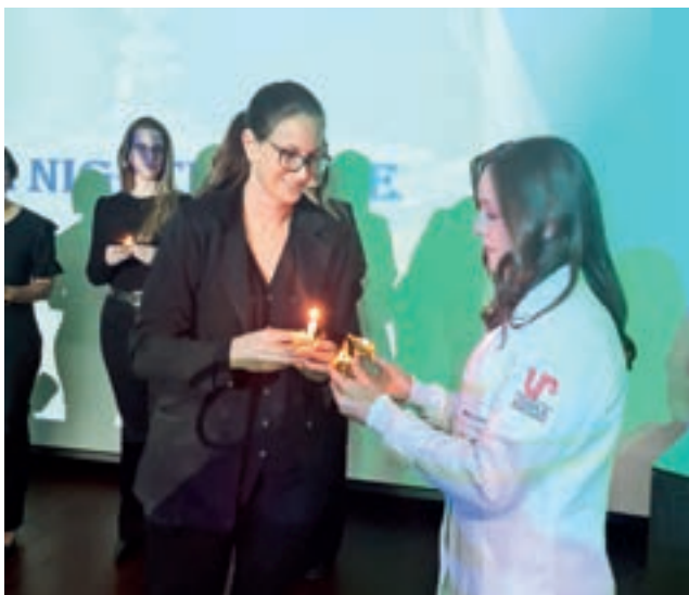
Formandos recebem dos professores a lâmpada do conhecimento