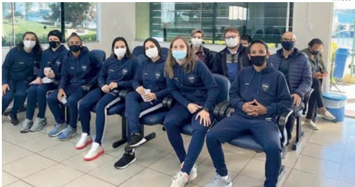
Elenco do Stein Futsal foi até o Hemocentro para fazer doações

O time tinha jogo marcado contra o SUMOV-CE para este sábado, mas a partida foi adiada. No domingo, a equipe fará o jogo da volta no amistoso contra a Seleção do Paraguai. Na primeira partida, disputada no Ginásio da Neva, as cascavelenses venceram por 6 a 0.