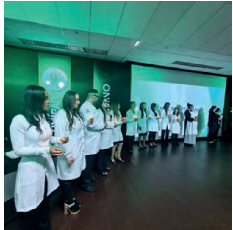
Formandos se alegram com a lâmpada do conhecimento

que remete ao compromisso dos futuros enfermeiros de manter acesa a chama da busca constante pelo conhecimento científico e a responsabilidade de acolher e cuidar do ser humano.