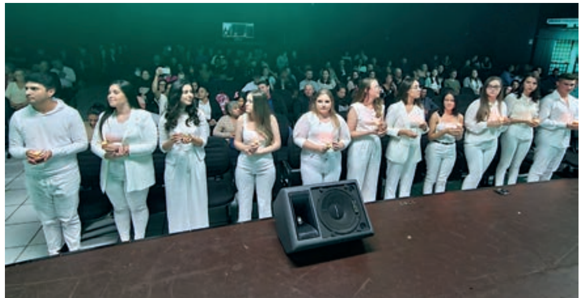
Alunos do 4º ano também participam do ritual

No ritual, os professores acenderam as lâmpadas dos formandos, que acenderam as lâmpadas dos alunos do 4º ano. Familiares dos acadêmicos prestigiaram e se emocionaram. Na cerimônia teve, ainda, a oferta dos instrumentos de trabalho do enfermeiro, homenagem aos pais e aos mestres, e a bênção aos futuros profissionais.