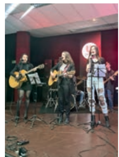
Acadêmicos abrem evento com apresentação cultural