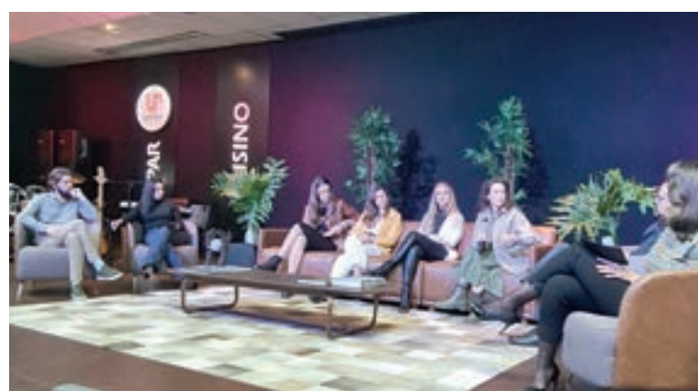
Decoração: D' Angelis Mega Store é parceira do evento