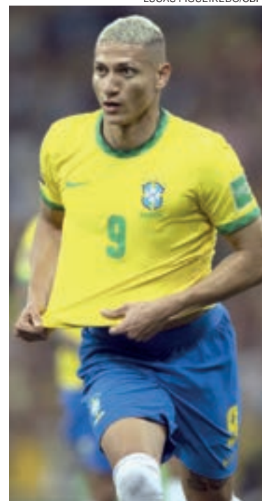
Richarlison é o artilheiro da seleção nas últimas quatro partidas