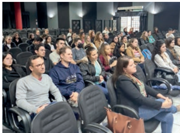
Acadêmicos de Arquitetura participam de talk show

organizando eventos e experiências sensoriais. Hoje me sinto confortável em atuar e contribuir com meus colegas”.