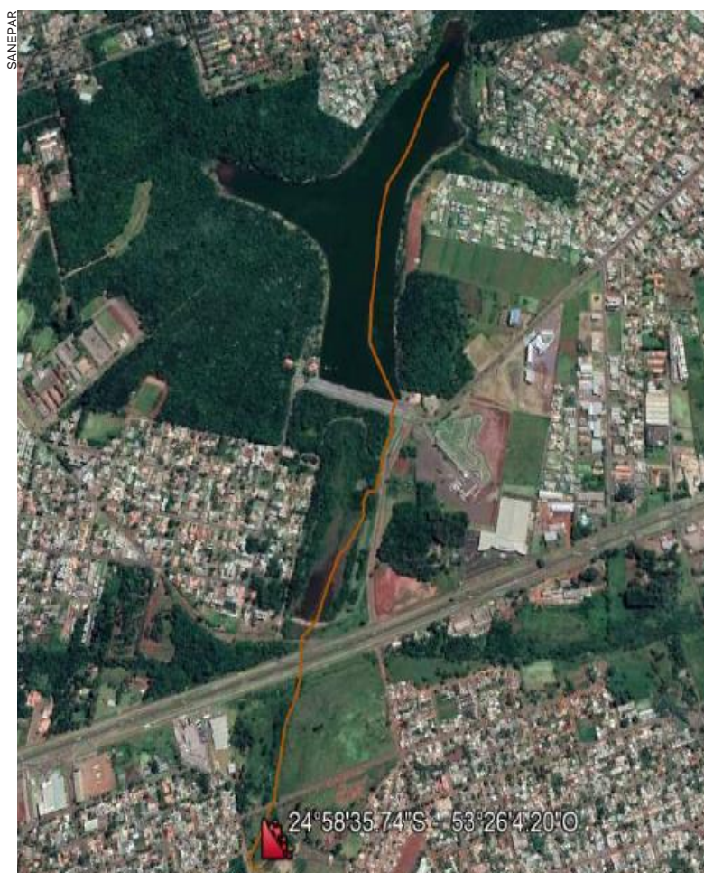
Sedimentos retirados do lago serão “transportados” para área já determinada no projeto

Ele lembrou que a obra vai ajudar na conversação do manancial, que é o principal abastecedor de água da cidade que além do Rio Cascavel, conta com a água dos rios Peroba, Saltinho e São José. “A ideia é