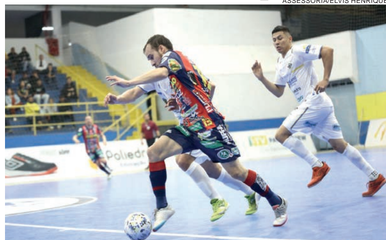
Após boa sequência na LNF, Cascavel defende liderança no estadual

Outras duas partidas movimentam o campeonato esta noite, ambas válidas pela 14ª rodada. Em Chopinzinho, a ACEL recebe o Marreco, a partir das 20h. No mesmo horário, em Campo Mourão, o time da casa recebe o Guarapuava.