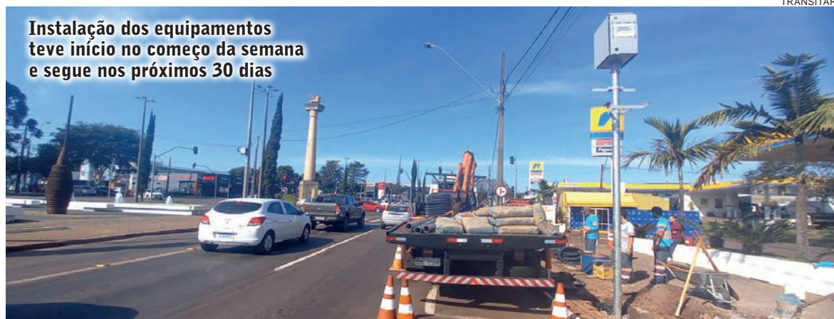
Instalação dos equipamentos teve início no começo da semana e segue nos próximos 30 dias