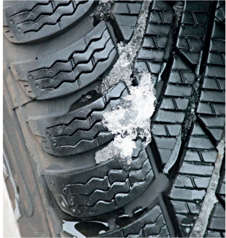
É importante verificar o desgaste dos pneus

No geral, todos os veículos precisam de cuidados nesse período, porém, carros movidos somente a etanol ou flex,