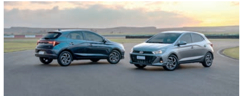
O Novo Hyundai HB20 é um carro à frente de seu tempo, inspirado nas preferências das novas gerações

A chave presencial também permite o travamento e destravamento das portas por proximidade, com o toque de um botão na maçaneta, e a partida do motor por botão no painel. Também estão disponíveis alavancas para troca de marchas no volante e o sistema Stop & Go (ISG), que liga e desliga o