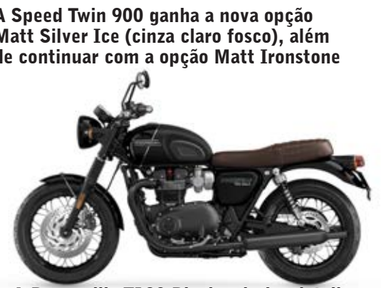
A Bonneville T120 Black valoriza detalhes prateados cuidadosamente pintados à mão