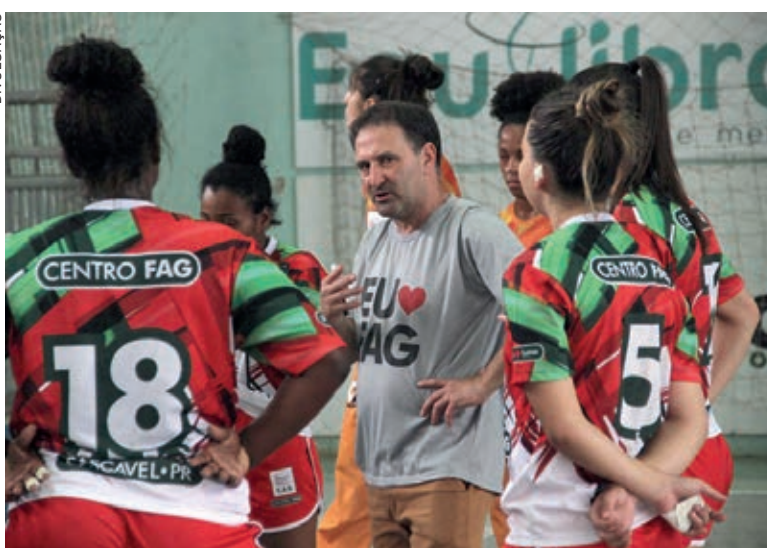
Neudi fará procedimento de alto risco em Curitiba

Além do alto risco, por conta das muitas ramificações nervosas na região, o procedimento