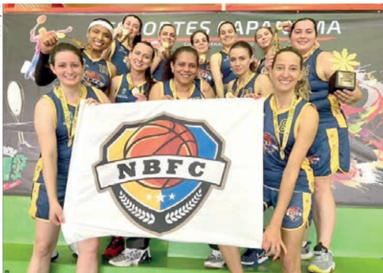
Basquete Feminino ficou com o título na regional

O Bolão Masculino fará sua estreia na próxima semana. Os adversários são Planalto, Capitão Leônidas Marques, Guaraniçu e Matelândia.