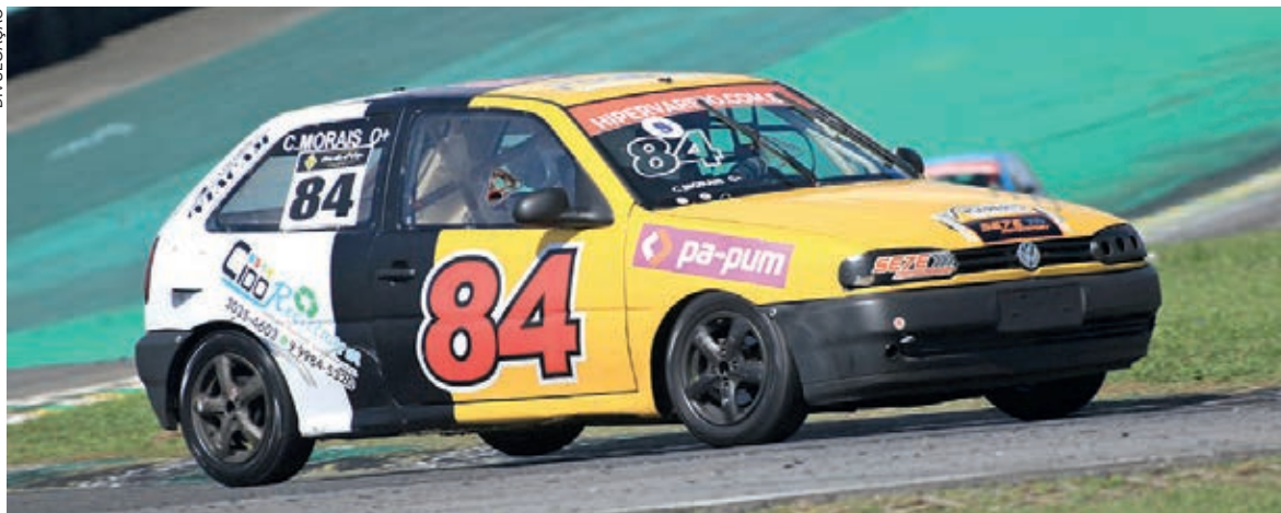
O cascavelense Cido Moraes disputa a classe Super, pilotando um Gol

Com 58 pilotos já inscritos, a 2ª etapa do Gold Turismo será disputada domingo, no Autódromo de Interlagos. O cascavelense Cido Moraes será um dos representantes do Paraná e tem como meta concluir a prova entre os 10 mais bem colocados da classe Super e almeja um pódio.