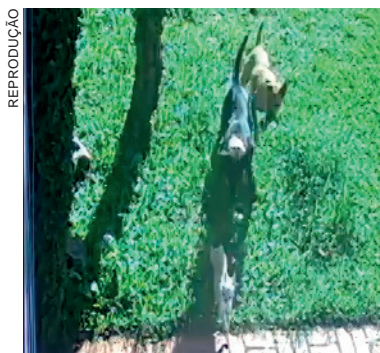
REPRODUÇÃO Imagem mostra ataque a animal registrado no dia 19 de abril: apreensão toma conta dos moradores

"Já fizemos boletim de ocorrência na Polícia Civil, liguei diversas vezes para o 156 [Ouvidoria Prefeitura de Cascavel], falei pessoalmente com o secretário do Meio Ambiente,