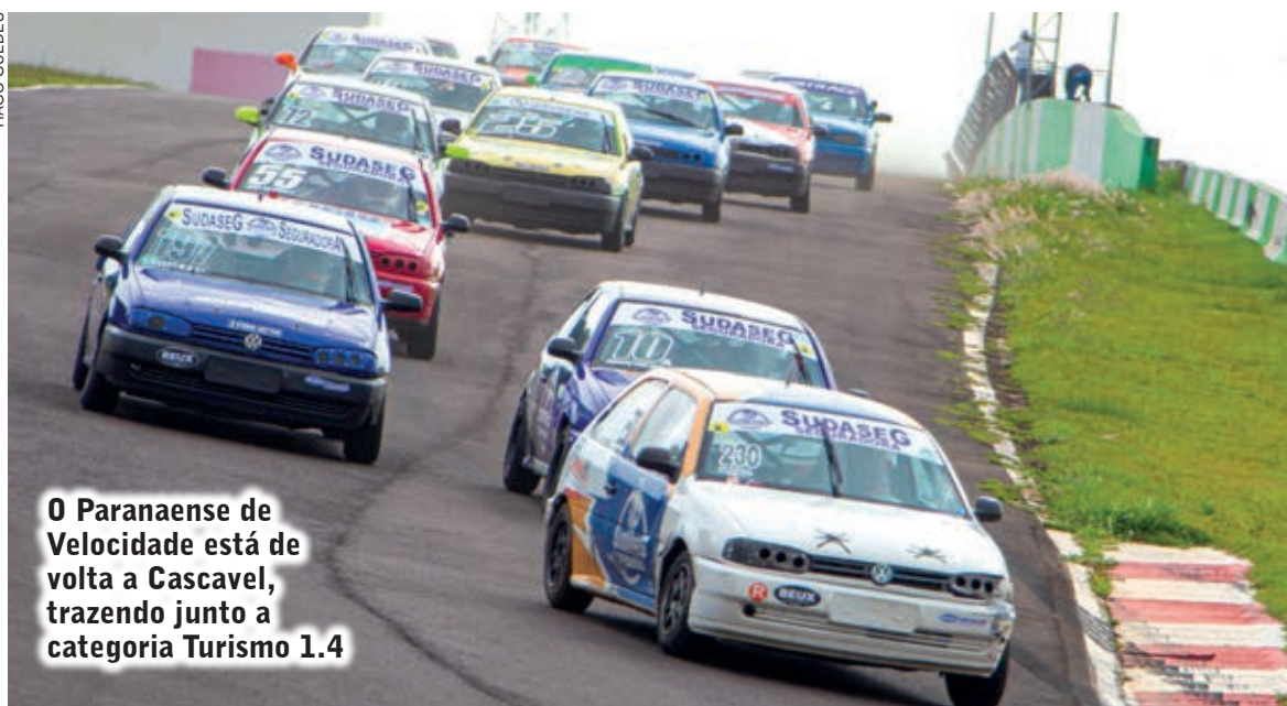
O Paranaense de Velocidade está de volta a Cascavel, trazendo junto a categoria Turismo 1.4

Turismo 1.4; e às 17h45, briefing para pilotos de todas as categorias.