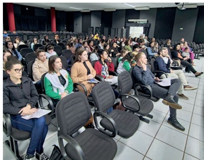
Acadêmicos prestigiam evento sobre inovação